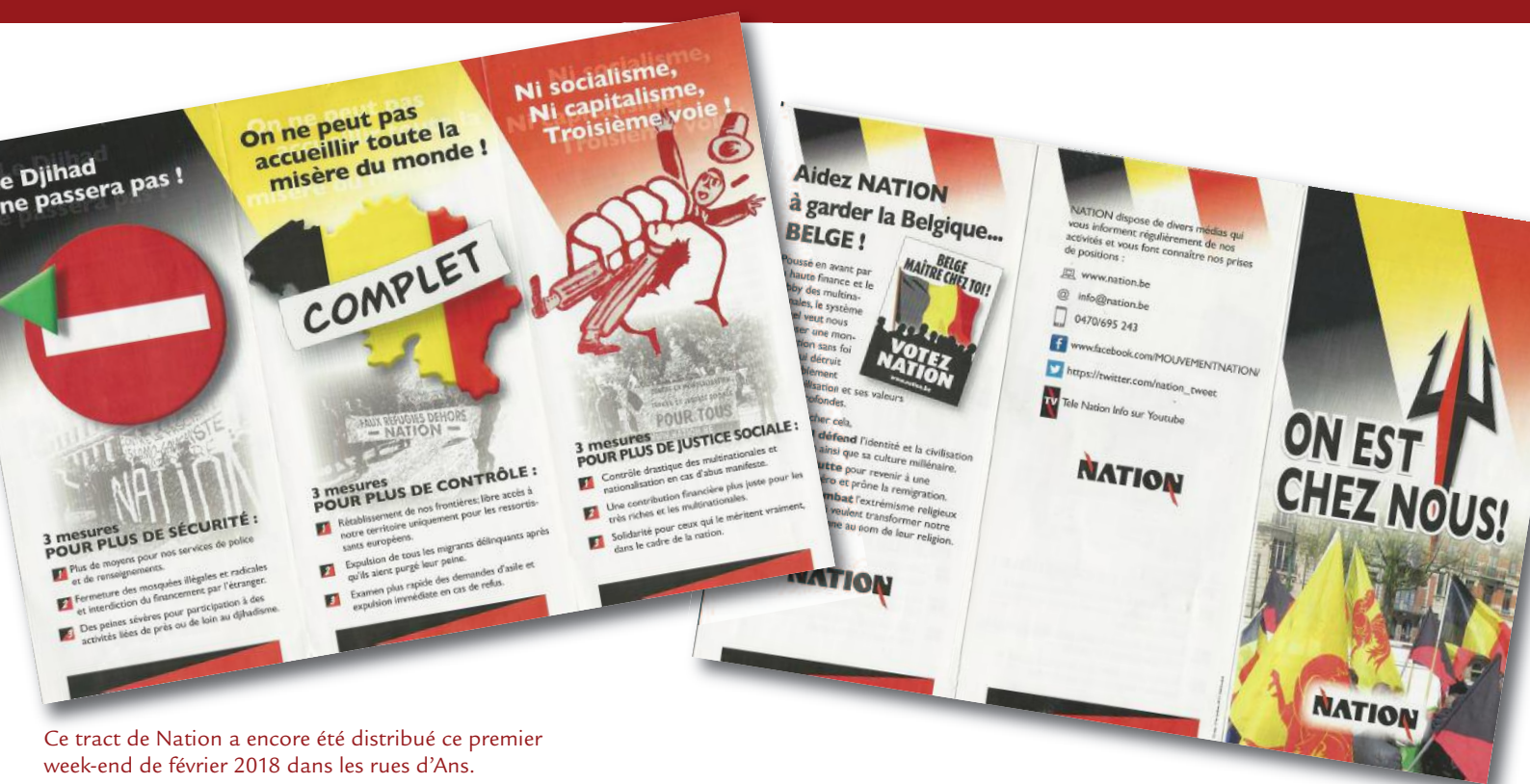
Ce tract de Nation a encore été distribué ce premier week-end de février 2018 dans les rues d'Ans.

accueillir toute la misère du monde ! », sont centrés sur l'immigration tandis que le troisième reprend un autre classique de l'extrême droite : « Ni socialisme, Ni capitalisme, Troisième voie ! ». On notera que les solutions aux « problèmes » soulevés ne sont que de l'ordre du répressif. Le verso est à nouveau centré sur l'immigration avec un « Aidez NATION à garder la Belgique... BELGE ! » accompagné de la volonté de défendre « l'identité et la civilisation européenne ainsi que sa culture millénaire » en prônant la « remigration » et une laïcité à géométrie variable comme la pratique Marine Le Pen car « Nation combat l'extrémisme religieux et tous ceux qui veulent transformer notre société européenne au nom de leur religion ». Religion qu'il faut comprendre comme étant uniquement l'Islam.