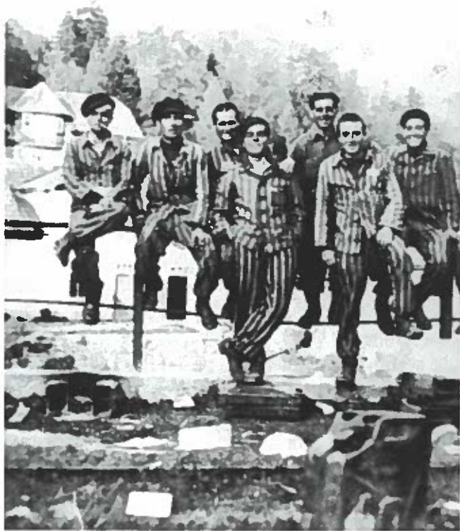
Mauthausen, le 5 mai 1945, jour de la libération du camp