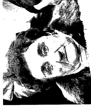
quelques jours dans des fermes de la région. «