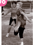
LES PERSONNES ÂGÉES