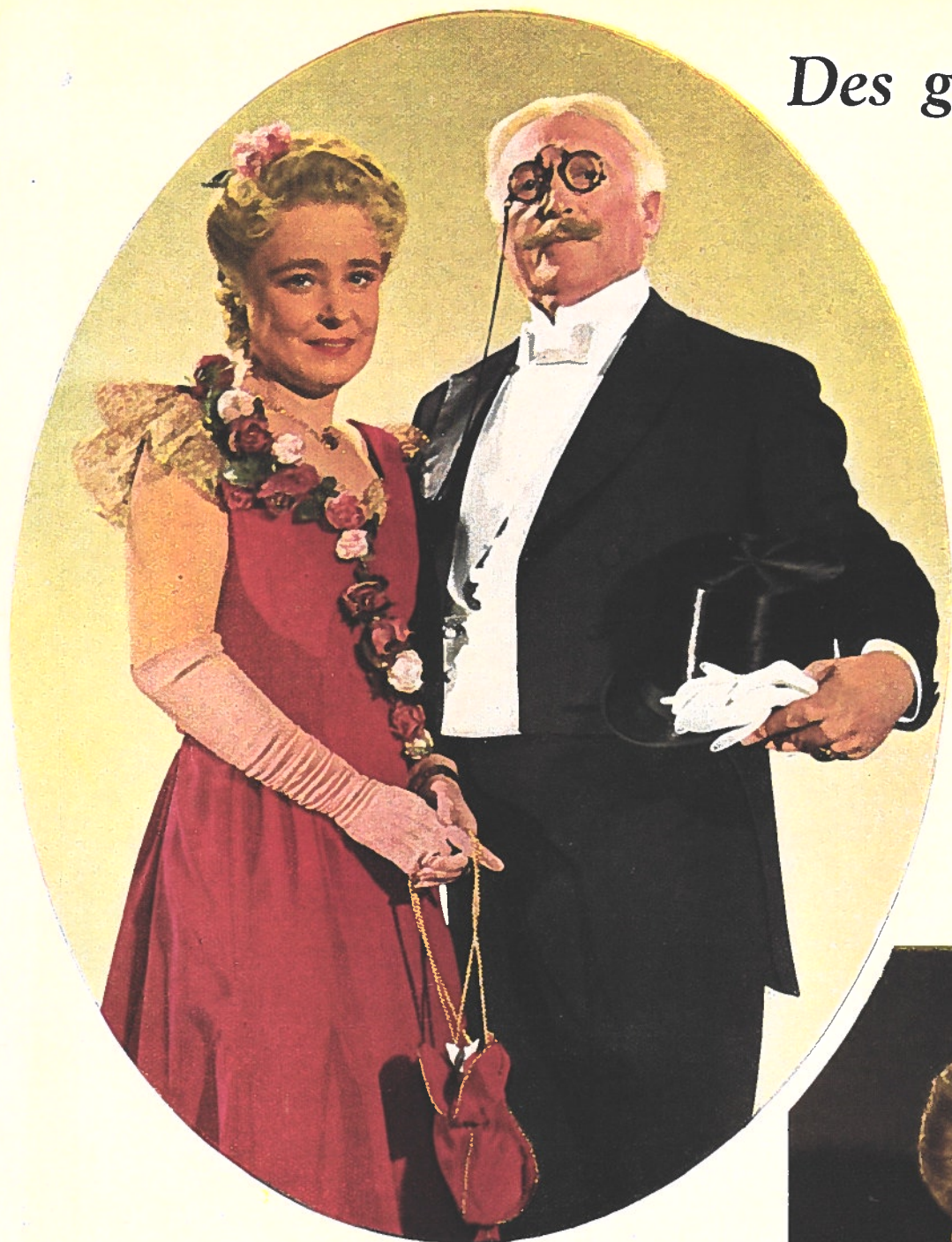
1887. Ainsi apparaît la bourgeoisie allemande aux fêtes de son époque. M. Dörsen, un employé respecté de l'Etat (Werner Kraus), et son épouse d'une beauté rayonnante (Käthe Haack), viennent d'accompagner leur fille Annelie, âgée de dix-sept ans, à son premier bal