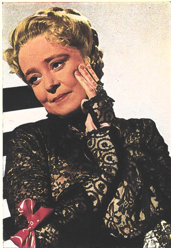
1880. La mère d'Annelie, une femme de la génération heureuse, contemporaine de Bismarck, et qui vit l'ascension du Reich vers la puissance mondiale

Du prochain film de la UFA: «L'Histoire d'une Vie», «Signal» publie quelques portraits de famille, caractéristiques des sept décades qui vont de 1871 à 1940