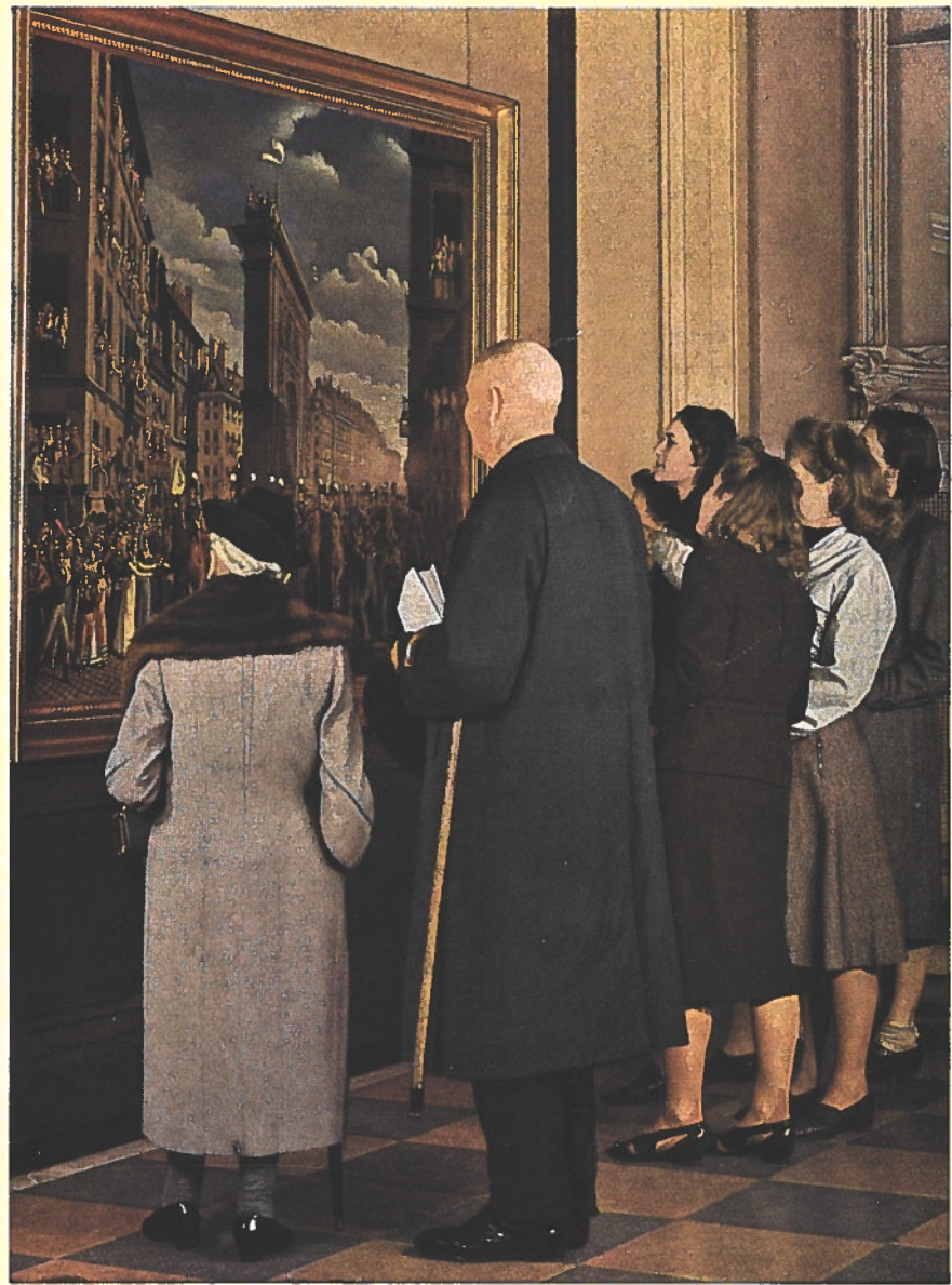
Devant un chef-d'œuvre inconnu, à la Galerie Nationale De temps à autre est organisée une exposition spéciale où affluent des visiteurs particulièrement nombreux