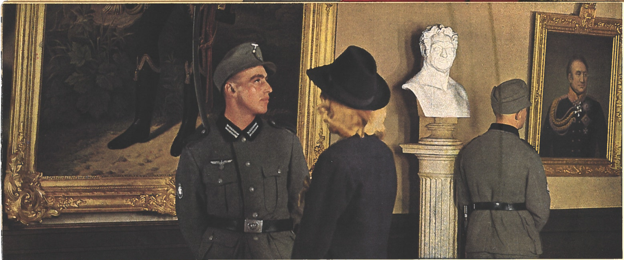
Une heure de loisir consacrée aux tableaux favoris... La salle des grands capitaines allemands des guerres de libération (1813—1815)