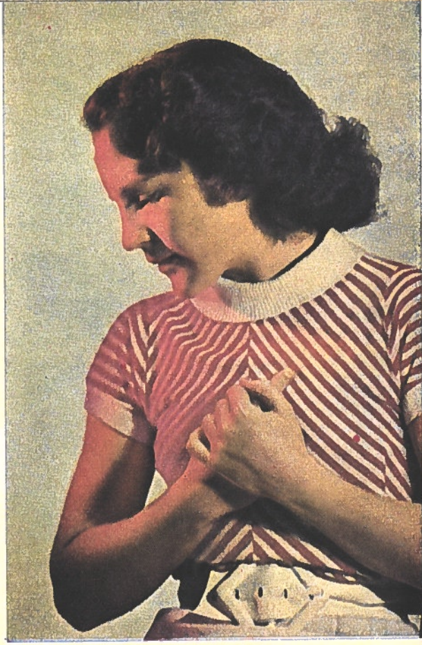
Rougeur pudique. Elle se répand sur le visage. C'est un rougissement provoqué par la lumière, comme le démontre également le pullover «qui rougit»