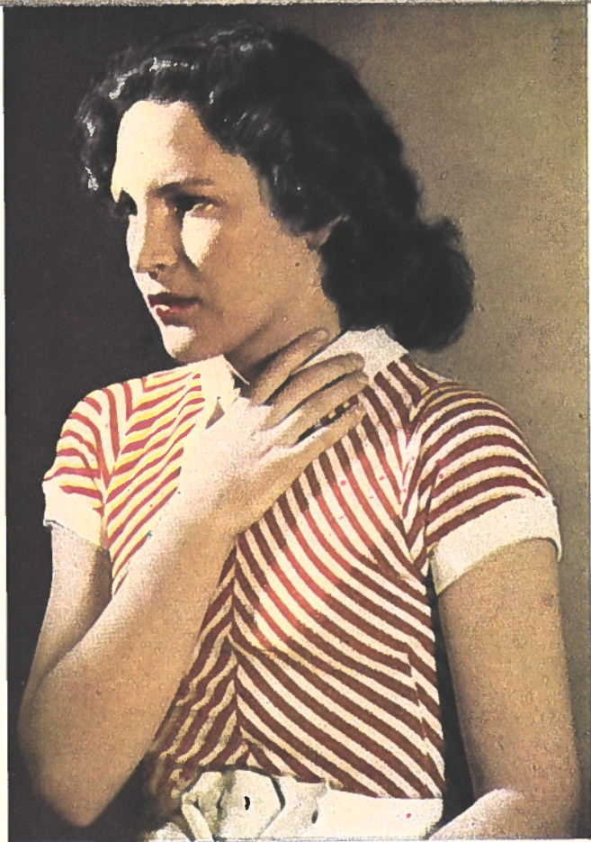
Blanc de peur ou, plus exactement, «bleu de peur», car la «pâleur livide», résulte de la lumière bleutendre

Les variations de l'éclairage créent des aspects différents. Mais les variations de physionomie d'une même personne trahissent des modifications correspondantes de son être mental ou corporel. La lumière chromatique peut donc faire surgir magiquement de l'objet soumis à l'expérience des valeurs matérielles ou psychiques, qui n'émanent point de l'objet lui-même. Quelques exemples, exagérés pour les besoins de l'enseignement, doivent révéler des possibilités qui jouent constamment un rôle important dans la cinématographie en couleurs