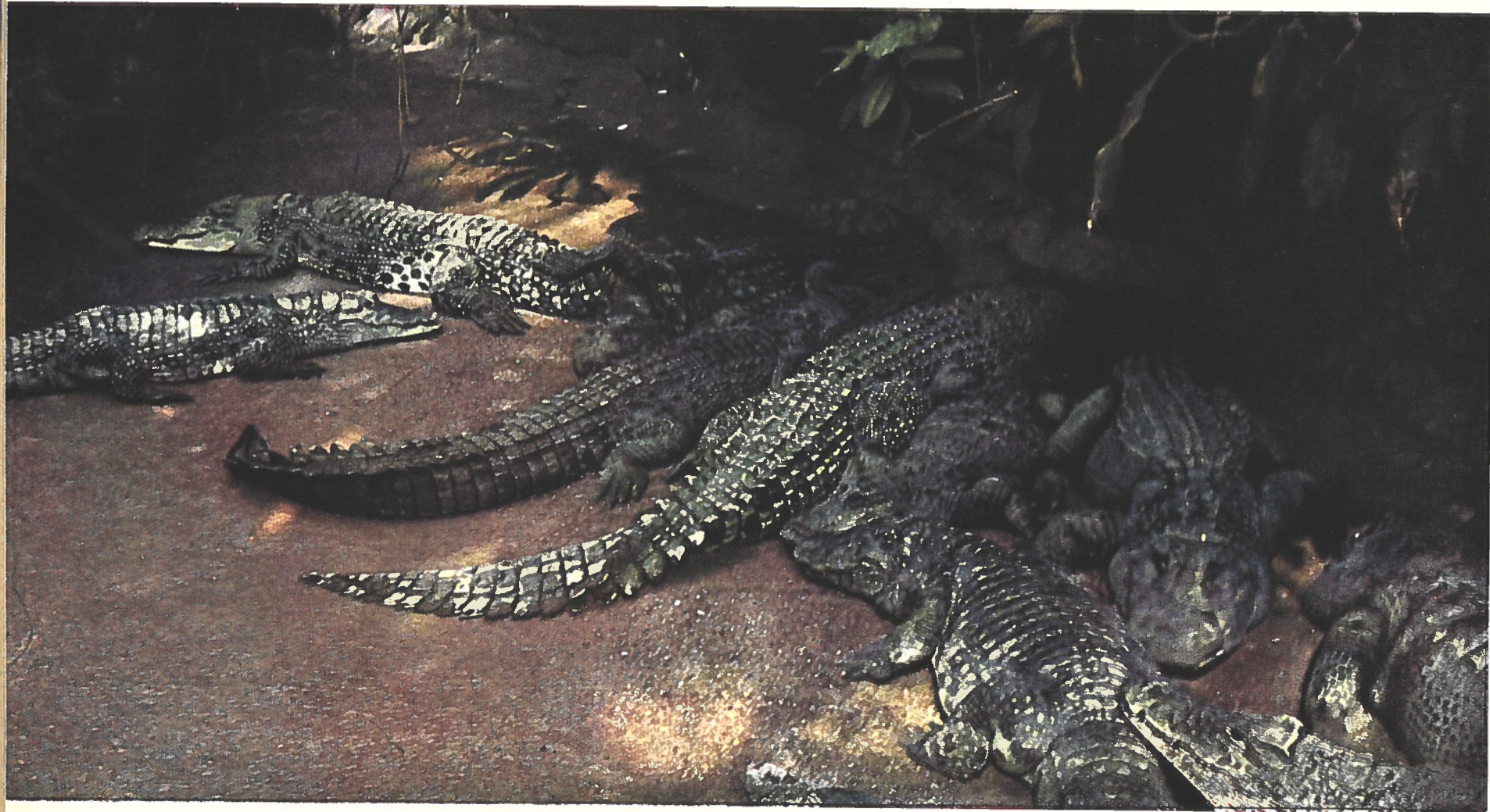
... ni en Afrique pour, le fusil et l'appareil photographique sur le dos, hanter les crocodiles. Il s'est tout simplement rendu ... au zoo de Berlin