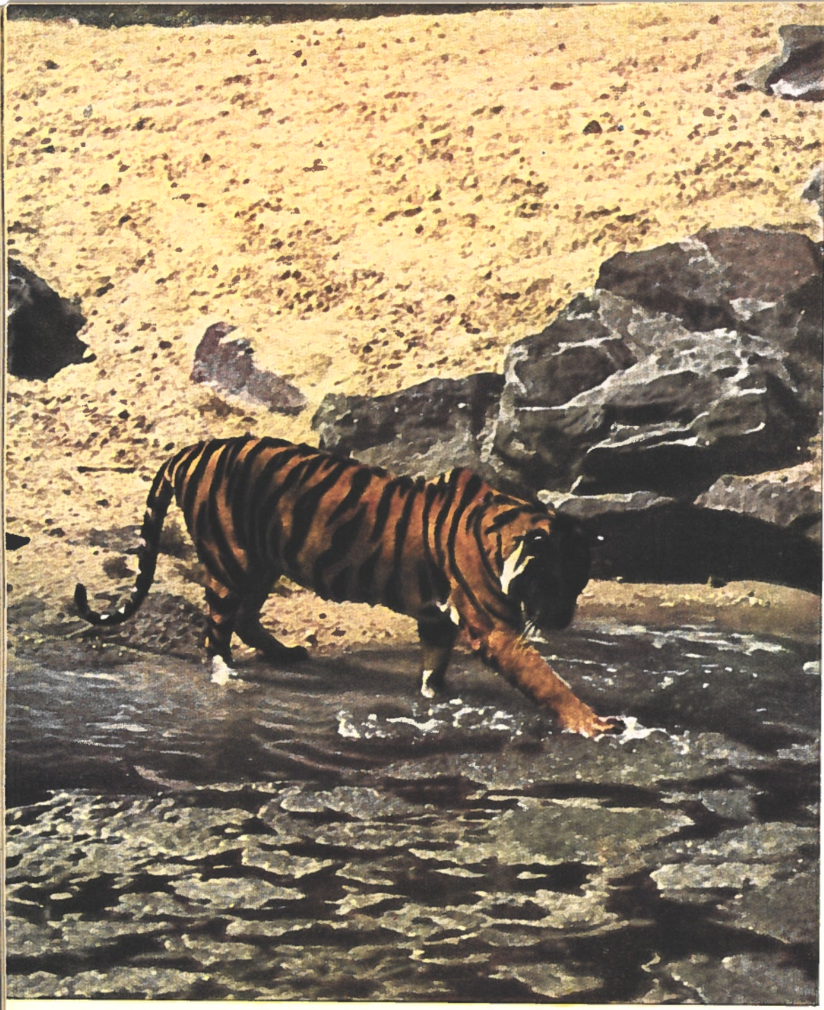
... ni aux Indes pour épier le roi de la jungle dans ses pérégrinations nocturnes...