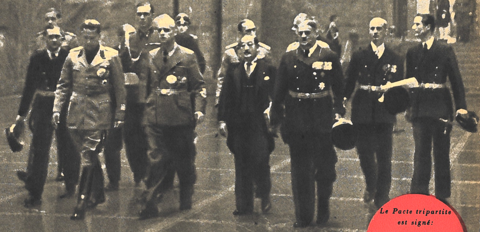
Le Pacte tripartite est signé: MM. von Ribbentrop, le comte Ciano et Kurusu quittent la Chancellerie du Reich