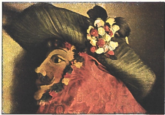
Un masque « lumineux ». De même que le « masque du soleil », il représente l'esprit positif de la lumière, et il est au service de la « Femme du soleil »