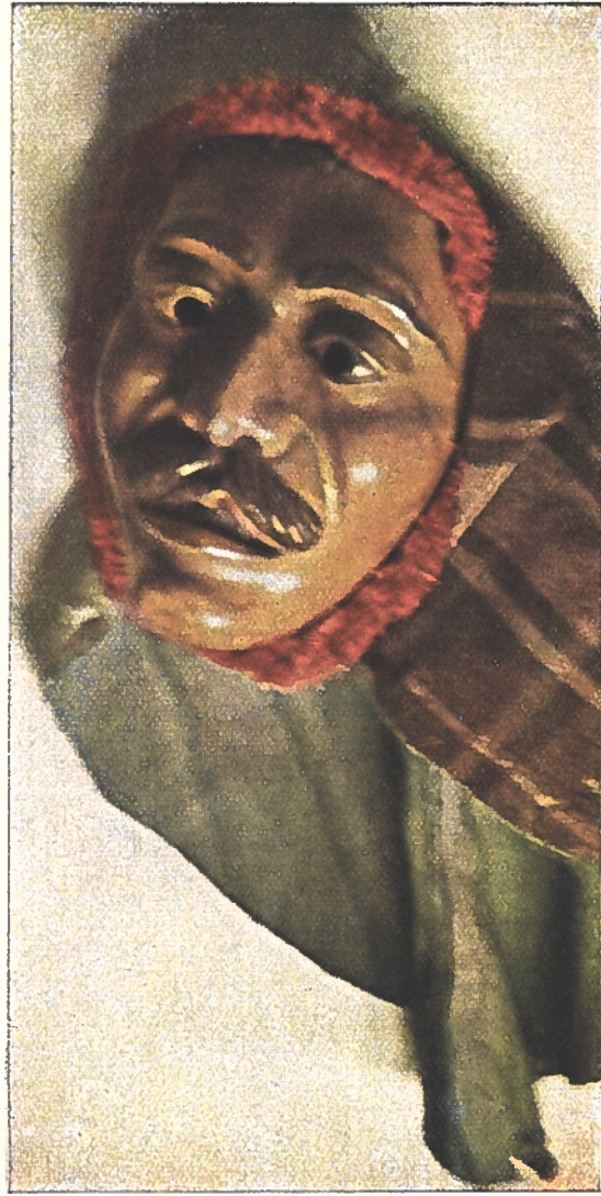
Un démon des ténèbres. Le masque s'ajoute à une toile et à des vêtements grossiers pour symboliser le déclin de l'année. C'est ce qu'on appelle une « sombre Perchte »; ces « Perchtes » vont le soir par les villages, célébrant le culte de « Frau Perchta »

Une coiffure fantastique, étincelante et multicolore, s'étage sur le « masque du soleil ». Ce masque qu'on porte à l'occasion de la « course des Perchtes », fait partie, depuis des générations, du patrimoine de chaque famille de paysans. Il est l'emblème du renouveau dans la nature