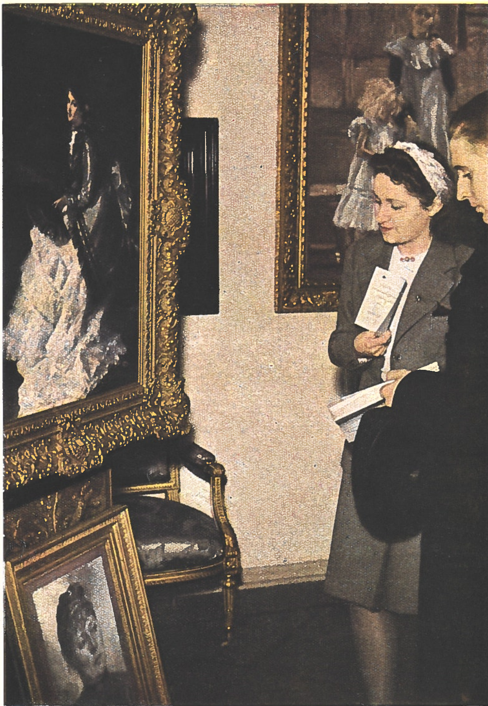
Des prix très élevés pour l'art du tournant du siècle RM 32000.— furent offerts pour le portrait d'une dame par Albert Keller. Plus bas, une étude de portrait par Menzel. Ci-dessus, à droite, « un jeune couple fraternel » par Fritz von Uhde