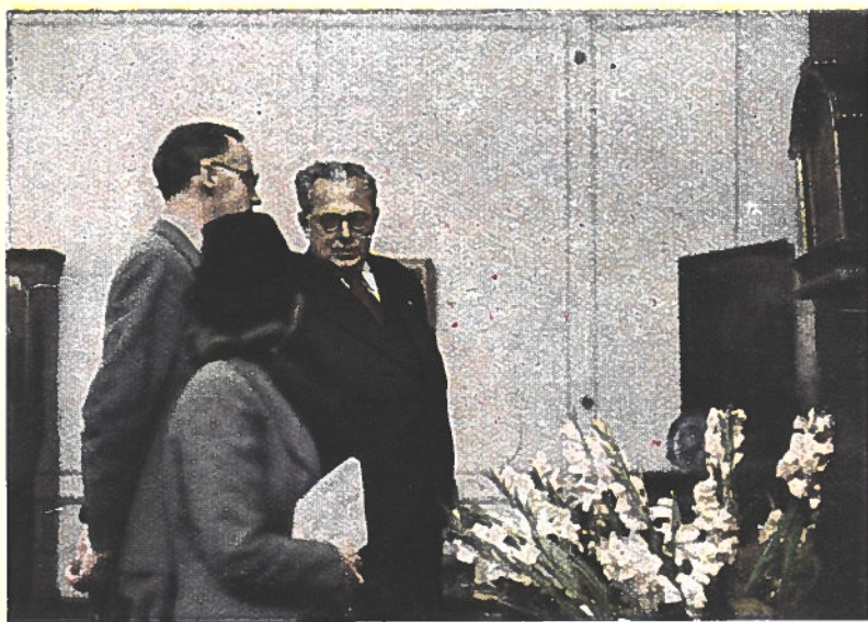
Amateur d'art et collectionneur passionné, le professeur Heinrich Hoffmann, le célèbre photographe du Führer, lui aussi, est présent à l'ouverture