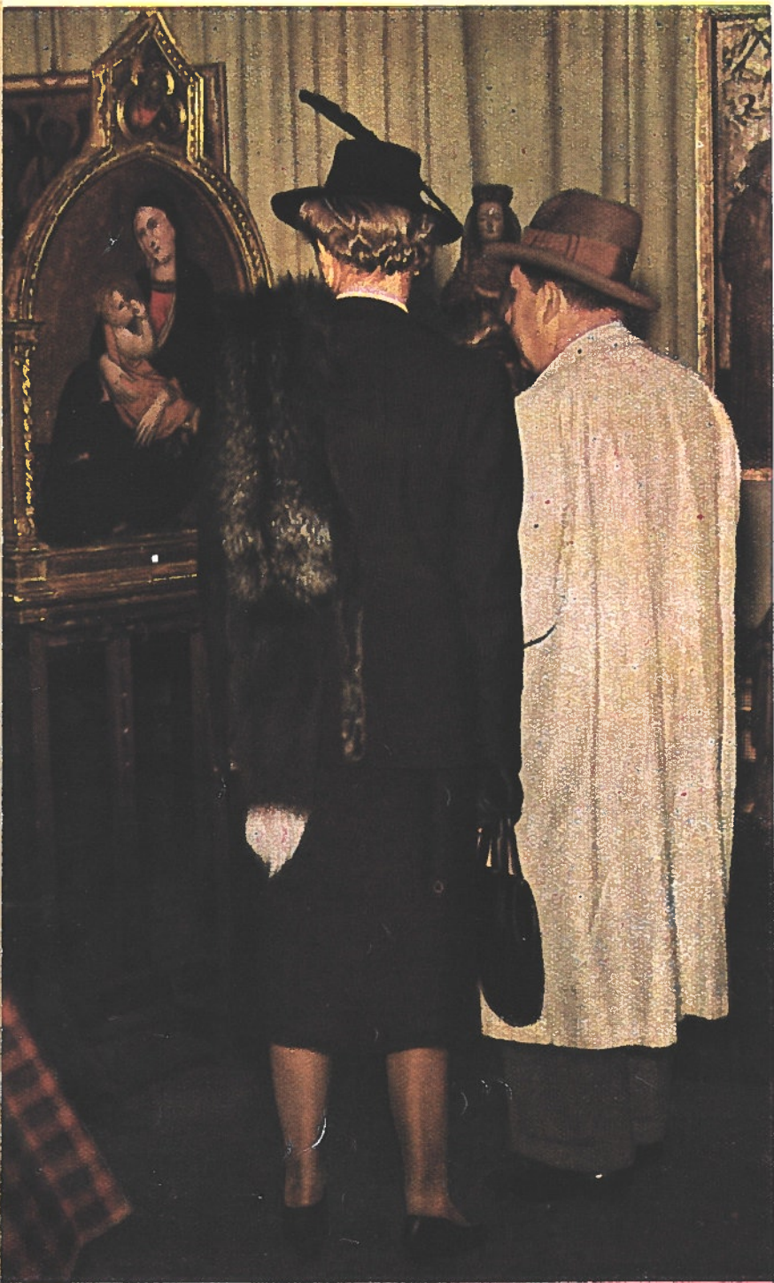
Tout comme les autres années, cet hiver vient d'attirer aux ventes publiques du marché d'art à Berlin une foule de gens avides de regarder et d'acheter