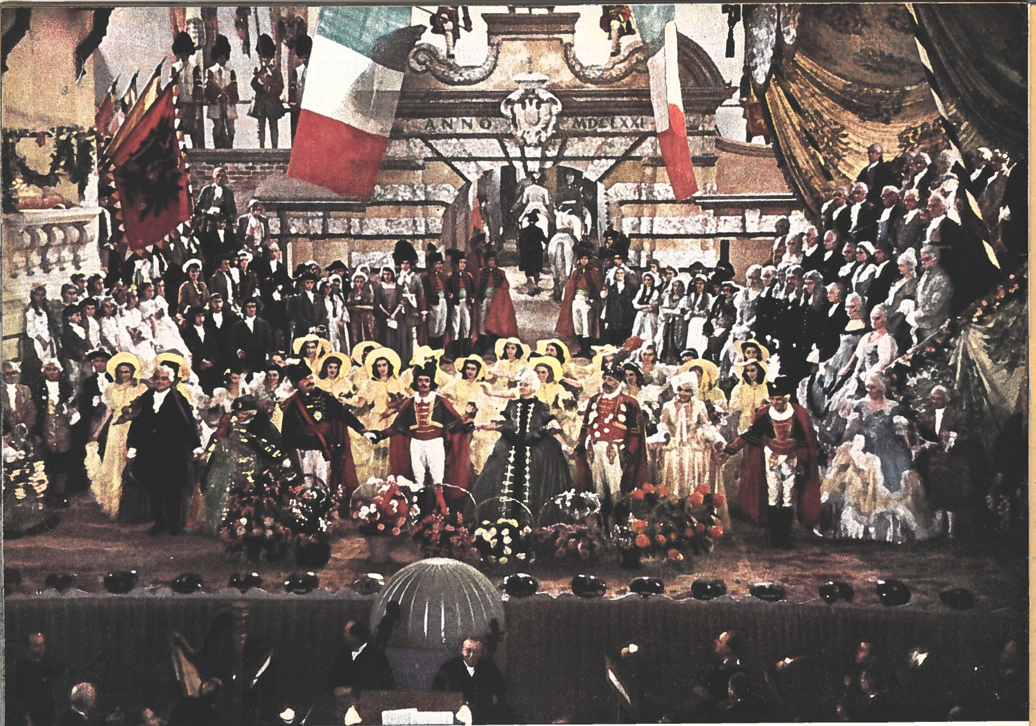
Voici la mise en scène du finale du « Baron Tzigane » par Jauner, le « plus grand homme du théâtre de son époque » selon les Viennois. Willi Forst qui, dans ce film, joue lui-même le rôle de Franz Jauner, a fait restaurer le Carltheater, fermé depuis longtemps, et il a reconstitué le modèle historique jusqu'au moindre détail. Jauner a été l'initiateur de la « mise en scène des foules »: il employait plus de cent figurants, commandait ses décors chez Makart, dépensait des sommes folles pour les costumes — et réalisait tout de même des bénéfices énormes