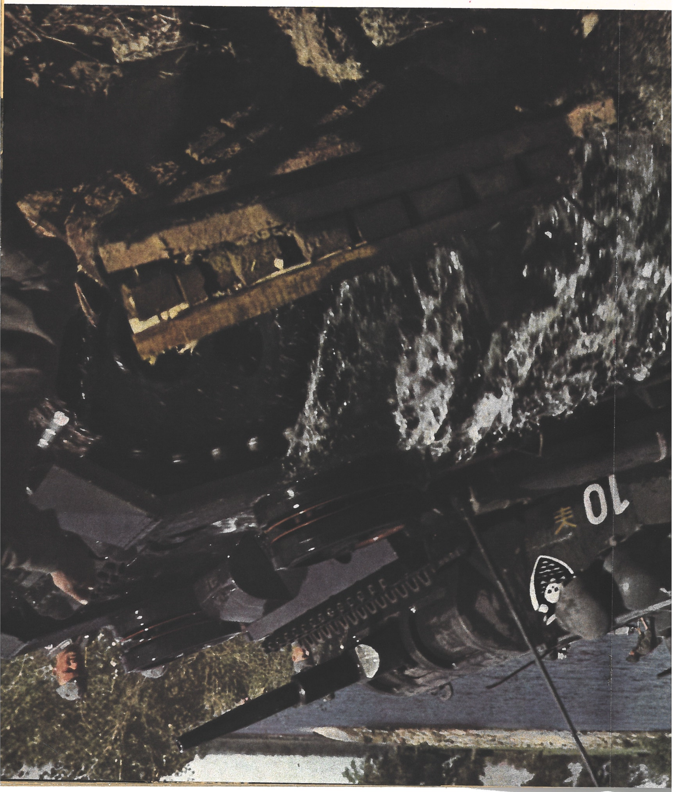
bilité de l' « affût bondissant » est telle que l'artillerie ennemie n'a pas le temps de régler son tir sur le véhicule. Les abris, les points d'appui organisés, les maisons fortifiées sont les principales cibles de cette pièce ambulante, dont le blindage est entièrement à l'épreuve des munitions d'infanterie. C'est au pas-lesquelles elles sont jetées en cas d'embourbement possible dans le limon ou la boue.