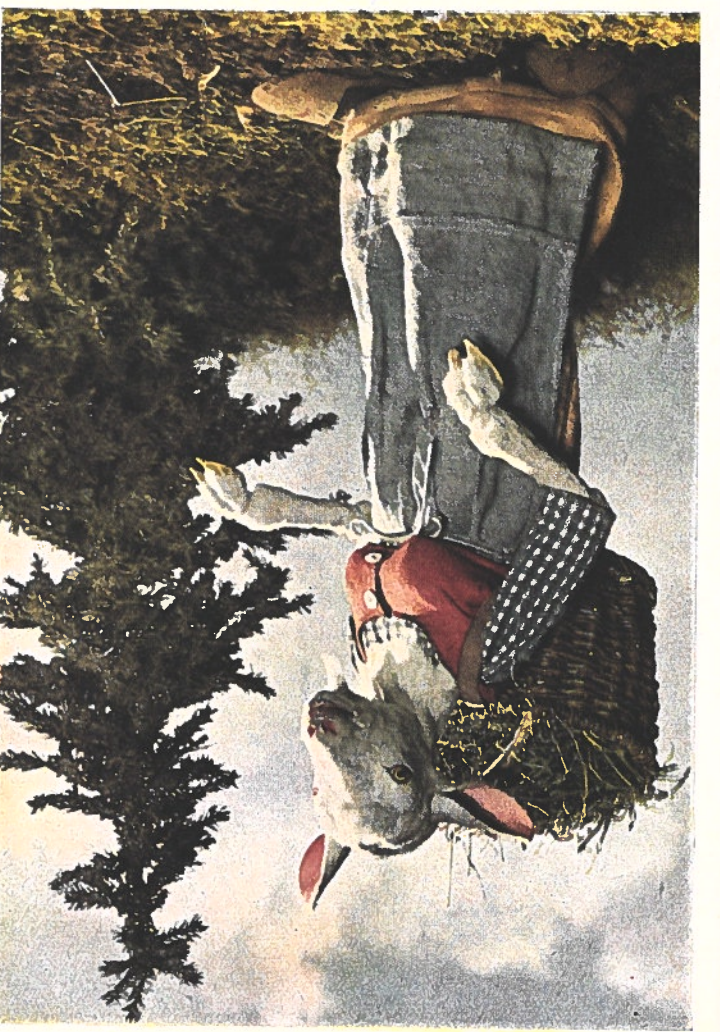
L'héroïque Mère Chevrete. Le corps chargé d'un lourd fardeau, sans se douter de rien, elle se hâte de rentrer chez elle et de retrouver ses petits. Elle ne sait pas encore que le grand méchant loup s'est introduit chez elle, et qu'il a dévoré tous ses pauvres petits, à l'exception du plus jeune qui a réussi à se cacher. Mère Chevrete ne se décourage pas: elle découpe à son loup le gros ventre du méchant loup, et le film « Les 7 Petits Chevreaux » nous montre ces derniers qui en sortent sains et saufs

animé. Par x d'enfants ue les palpi- s de conte e mur blanc ures d'ari déjà loup homme qui vement. Un de l'aidé our les en- mouvant de corps i de cartou- charnières, tère con- res écrivit aux contes ois meilleur ansstall für ères Diehl rande joie celle des ns diverses