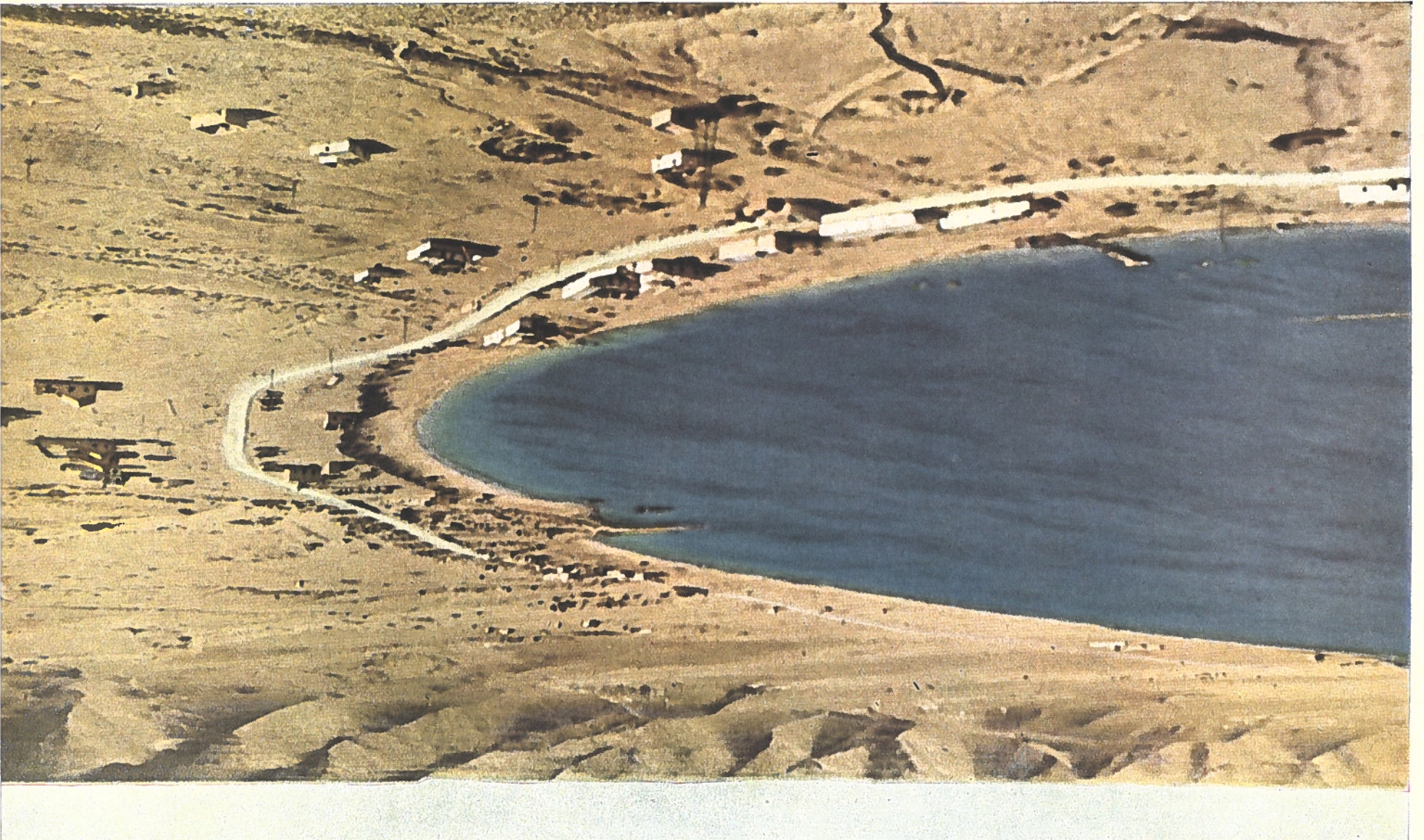
Entre la Libye et l'Égypte

Une ceinture d'environ 1.000 kilomètres de largeur, sans chemins ni routes d'aucune sorte, le désert de Libye, s'étend entre les grands centres de Libye et d'Égypte. A deux endroits seulement, autour de l'oasis de Sive-Djaraboub, et 200 kilomètres plus au nord, à Sollum, sur la côte méditerranéenne, le terrain se prête à des opérations militaires de quelque importance. Les Anglais avaient fait de Sollum un puissant fort; ils avaient également fortifié sa baie, qui atteint les monts granitiques du désert. Sollum avait ainsi l'importance d'un petit Gibraltar