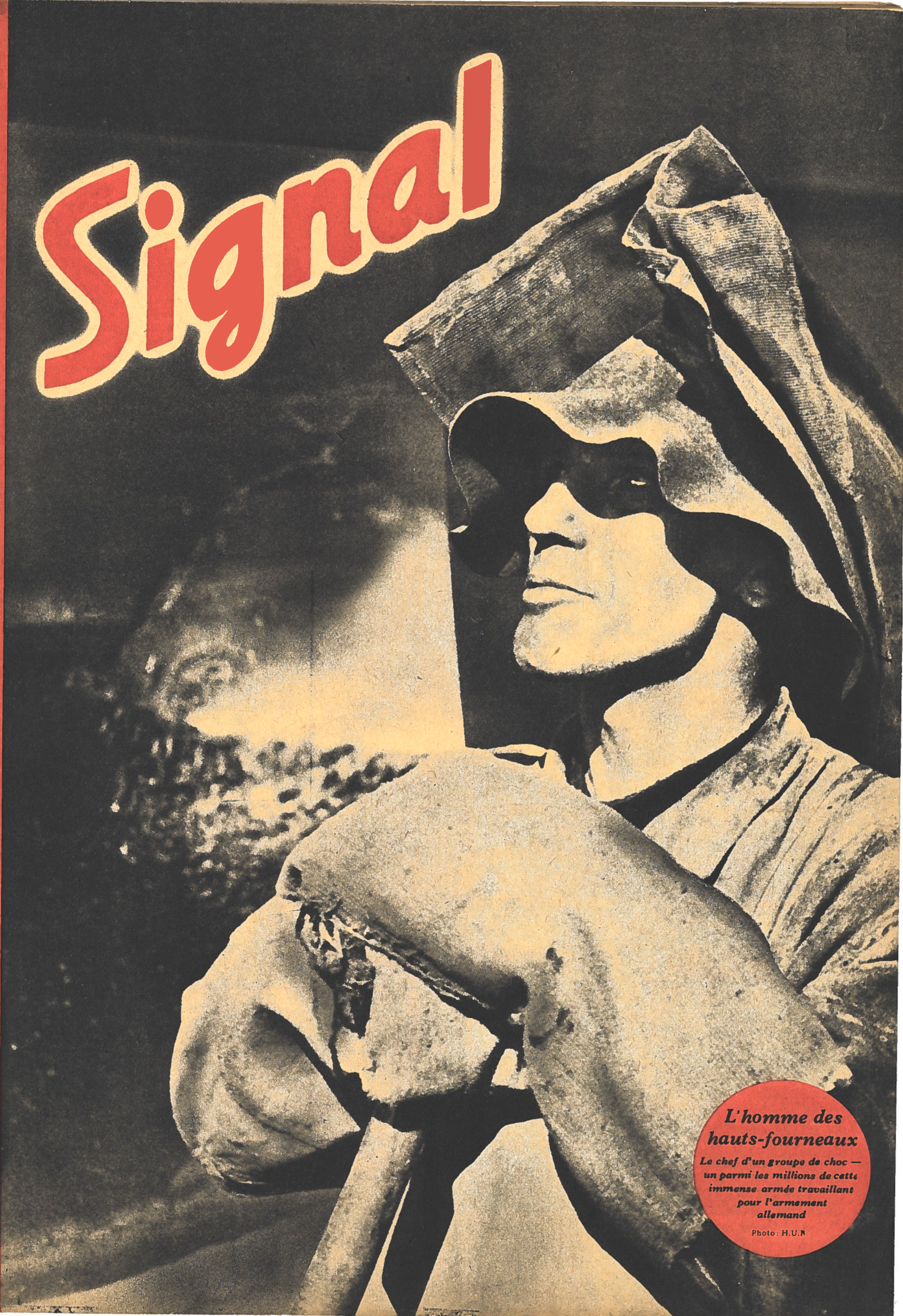
L'homme des hauts-fourneaux Le chef d'un groupe de choc — un parmi les millions de cette immense armée travaillant pour l'armement allemand