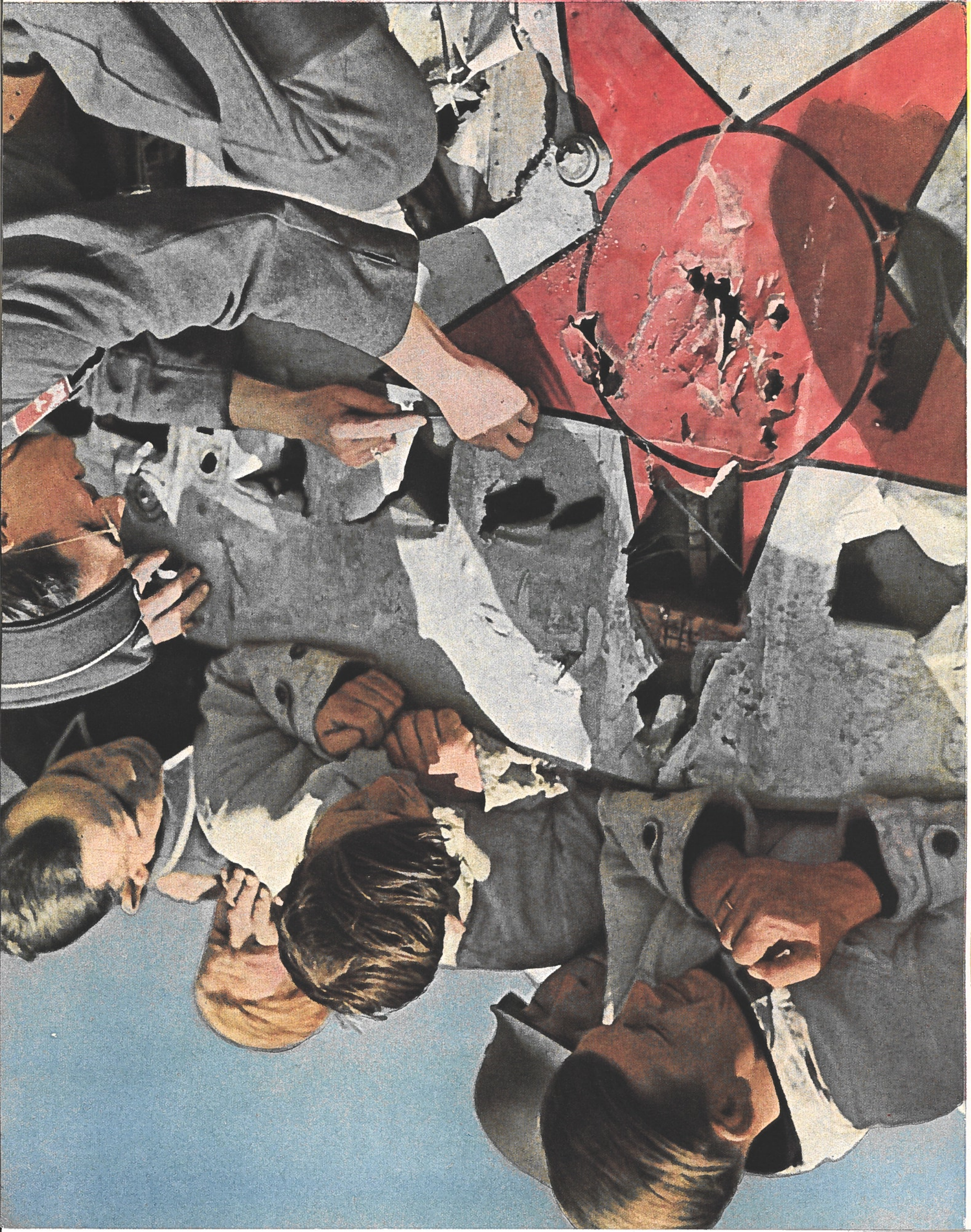
En souvenir d'un bombardier soviétique abattu.