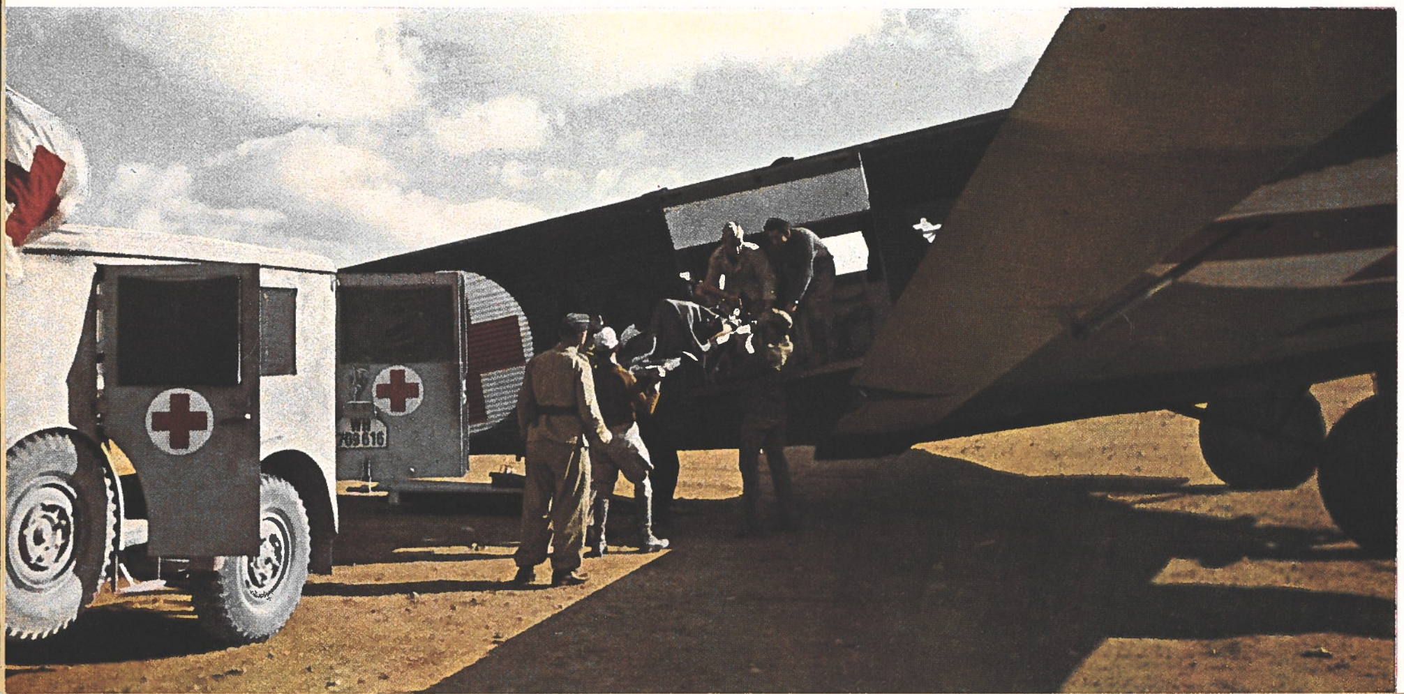
Sous le signe de la Croix rouge. Des blessés des combats en Marmarique sont installés dans un « Ju 52 » qui va les ramener en Allemagne.

L E 2 sou Gortsch cipautés territoire d'intérêt las ava venu de C'est théâtre Crimée. histoire autour La Tu Russie l'appui européenne bonnes en aide plus tar sait l'im prix que Dardane rêt à m L'Autric attitude Le 3 Nachim près de