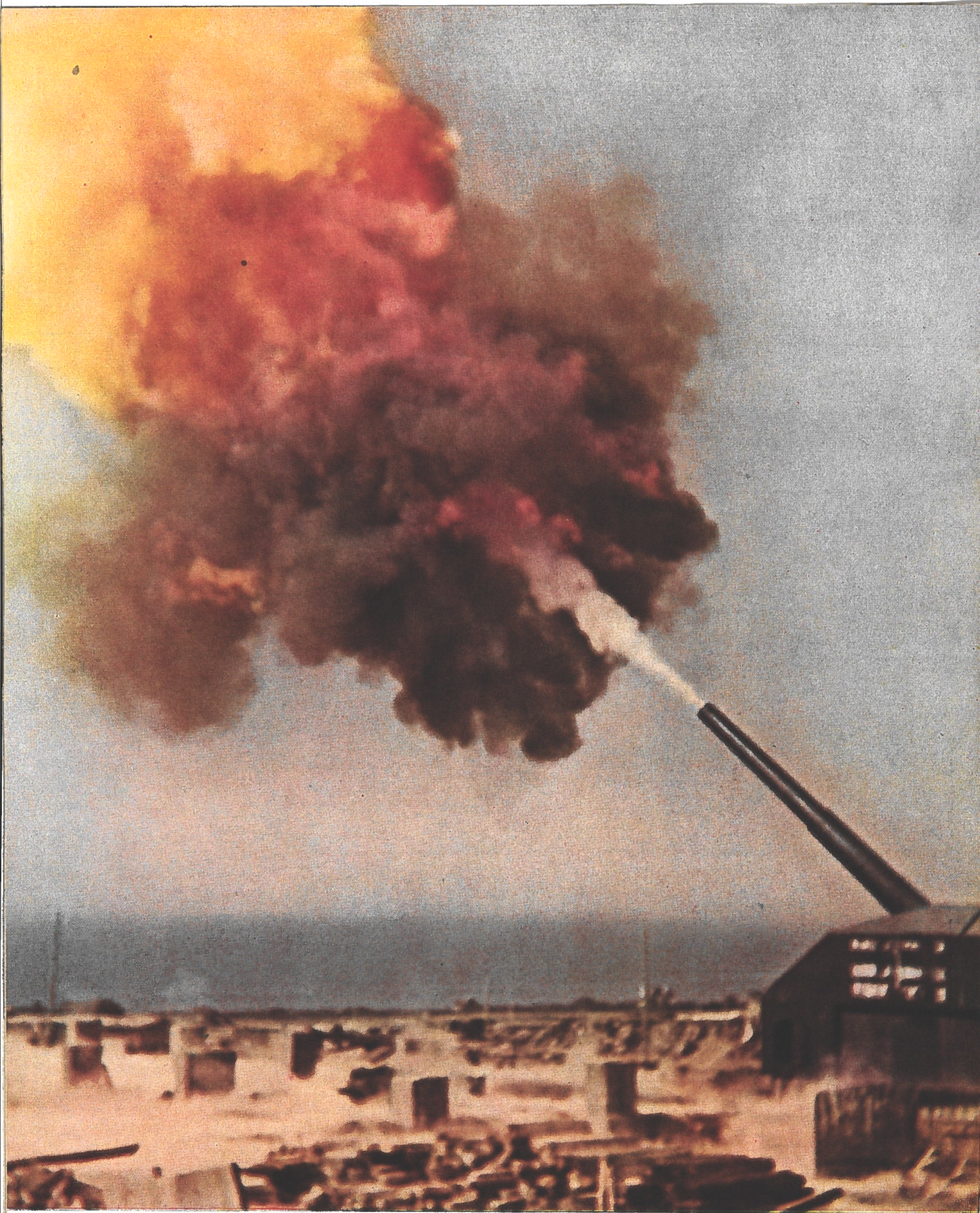
A l'ouest, auprès d'une batterie côtière Un coup de feu traverse la Manche et va en Angleterre