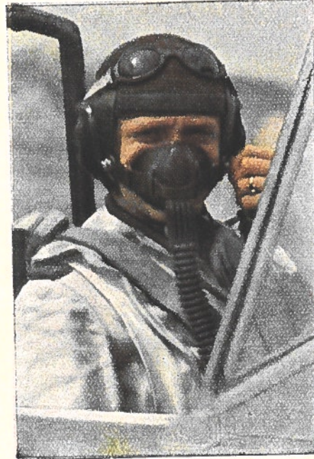
Dans le casque de cuir de l'aviateur est inséré un poste récepteur. L'équipement est complété par le masque à oxygène indispensable aujourd'hui, car les combats se déroulent souvent à plus de 7.000 mètres d'altitude