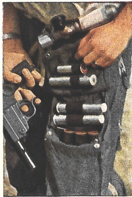
Dix cartouches éclairantes de diverses couleurs, avec le pistolet lance-fusées. Elles sont fixées à portée de la main, le long de la hanche, près d'un grand couteau pliant. L'aviateur possède en outre deux cartouches fumigènes