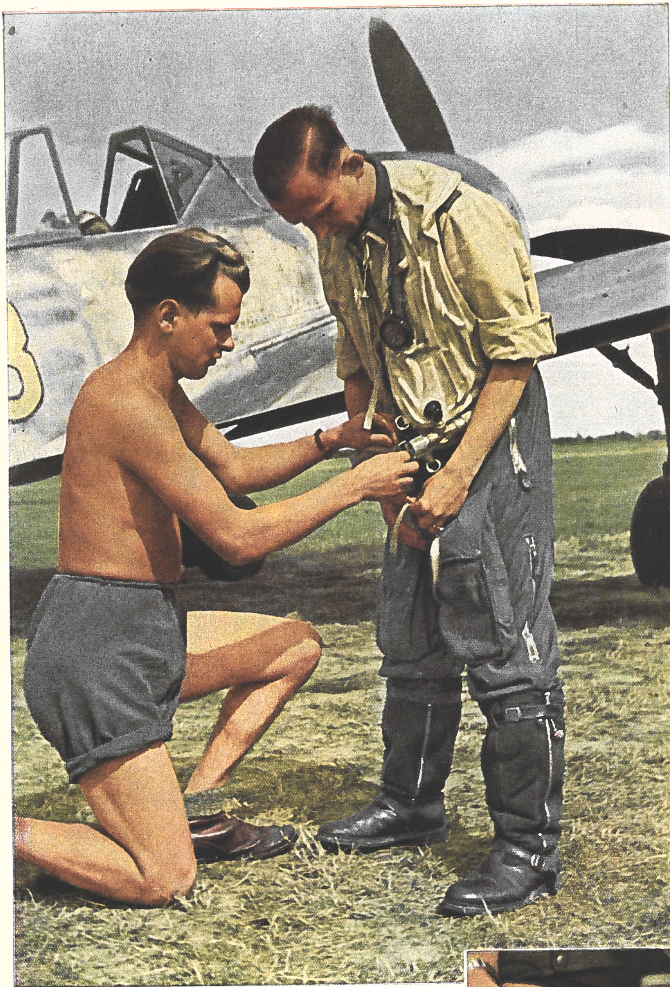
Deux des pièces les plus importantes de son équipement de combat sont la ceinture de sauvetage et le parachute. Ces deux objets ont déjà sauvé la vie à maints aviateurs