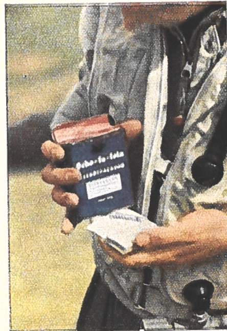
Chaque aviateur reçoit une boîte de chocolat comme vivres de réserves. Cette boîte est entourée d'une enveloppe imperméabilisée que les aviateurs glissent dans la blouse spéciale des traversées aériennes