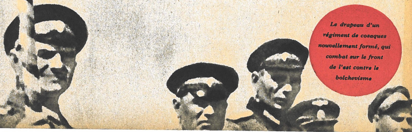
Le drapeau d'un régiment de cosaques nouvellement formé, qui combat sur le front de l'est contre le bolchevisme

СЛАВНО ХРИСТИАН СТАД ВЕРНО СЫНЫ ЗА ИДУТ В ШИ ЕСТЬ ДИМ БОИ