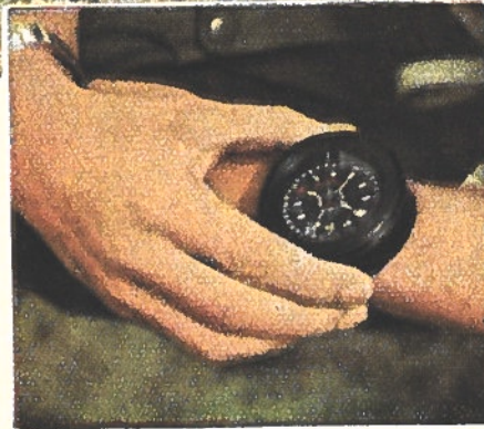
Un bracelet à chaque bras. A gauche, le bracelet-montre, à droite, la boussole, qui doivent toujours être à leur place. Le sac contenant les fusées pour signaux de détresse, le sachet de pansements et les lunettes teintées font également partie de l'équipement

Les combats au-dessus de la mer demandent un homme complet. Et un équipement pratique donne aux aviateurs de plus grandes chances de succès.