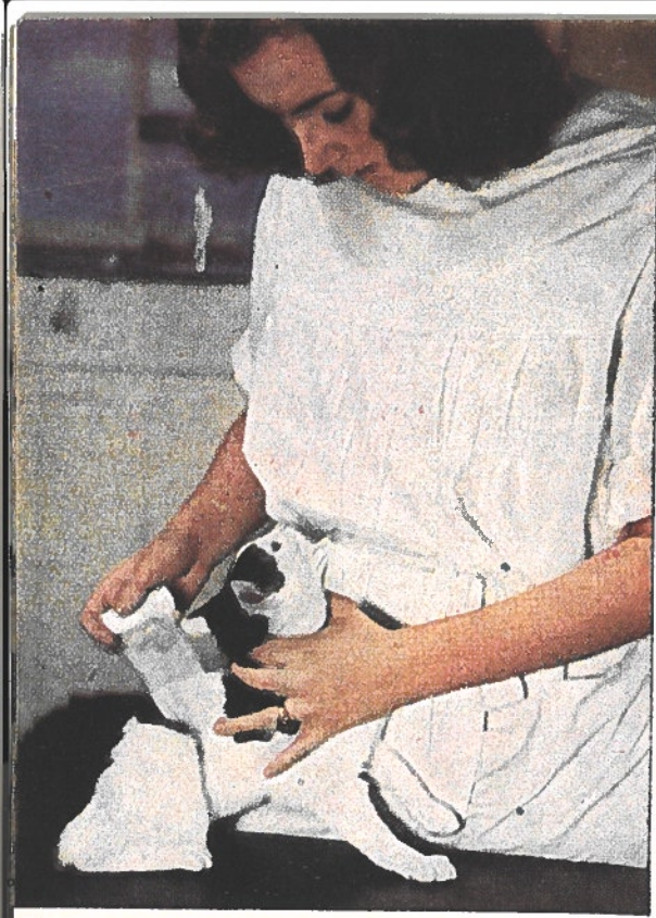
← L'heure de la consultation pour les animaux domestiques à l'école vétérinaire. L'étudiante assiste le vétérinaire traitant. C'est un petit tour de force que d'appliquer ce pansement, le chat, en effet, ne comprend pas hélas ! la nécessité de l'accepter sans broncher