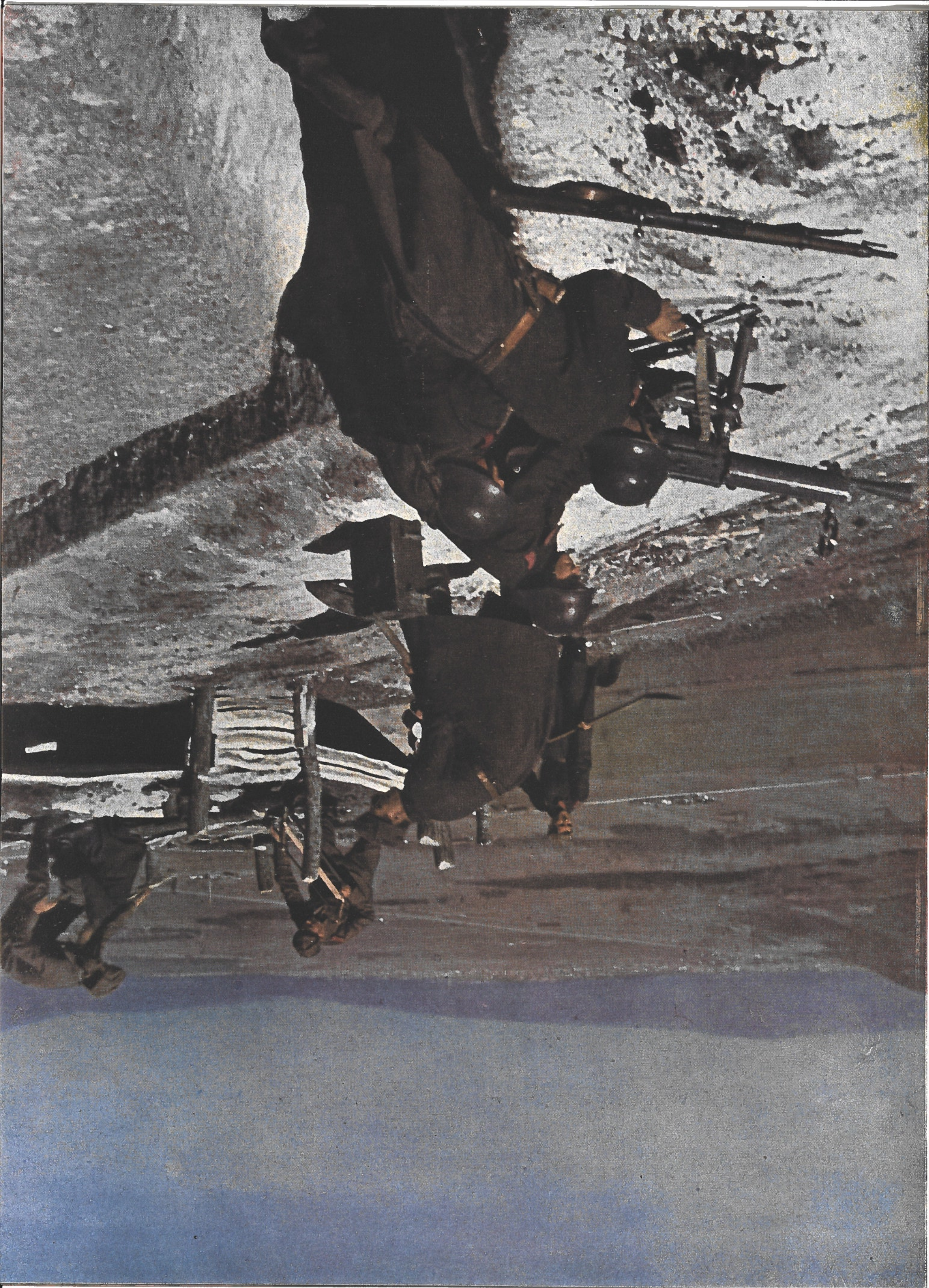
← Des divisions bulgares, dans la lutte garie, ont pacifié le pays

... sans des ré- été de leurs re vœux les n'avaient été constituée qu'une accomplir, mais On a pu pren- ue les volon- s ont prouvé pérille de leur à l'est a pro- caractère des offrent, pour espoirs qui l'Europe. Il nce et savoir s'annonce ait taires de l'est les armes ne es réalisations leur temps. Le risquent leur croit sans que ent à interve- nage que la euses mesures st. C'est là un on le remar- tre dans l'his-