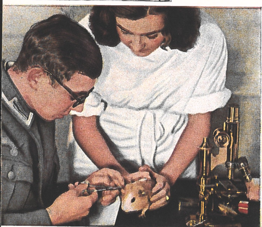
Au laboratoire on vaccine des cobayes; l'étudiante assiste un camarade plus ancien libéré du service militaire pour achever ses études (photo du bas)