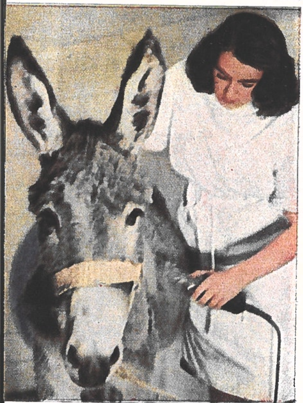
← L'âne a besoin d'être tondu. Les soins à donner aux animaux bien portants font aussi partie des séances d'instruction pratique pour devenir vétérinaire