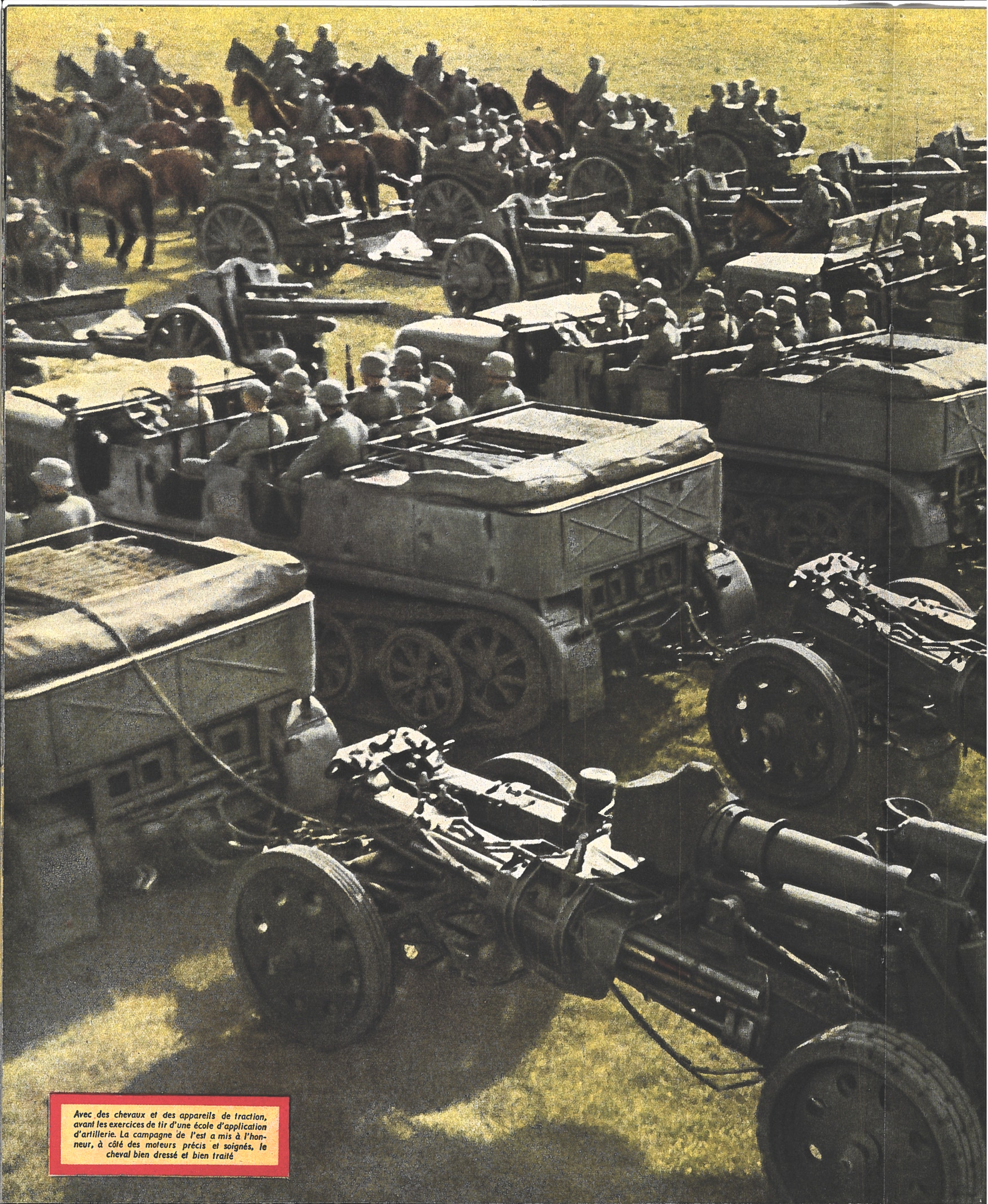
Avec des chevaux et des appareils de traction, avant les exercices de tir d'une école d'application d'artillerie. La campagne de l'est a mis à l'honneur, à côté des moteurs précis et soignés, le cheval bien dressé et bien traité