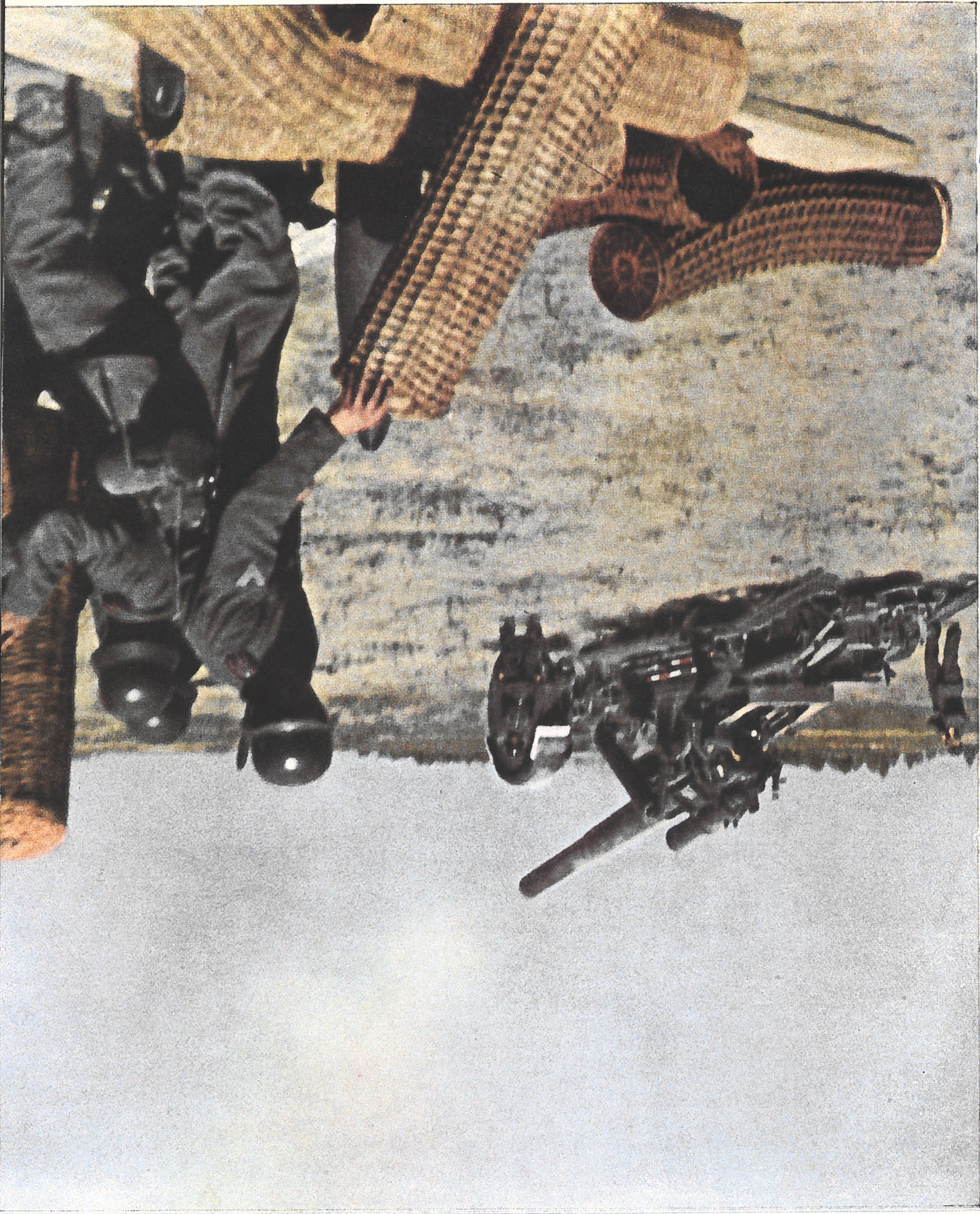
Bataille d'anéantissement. Mortier lourd allemand en action contre les positions soviétiques