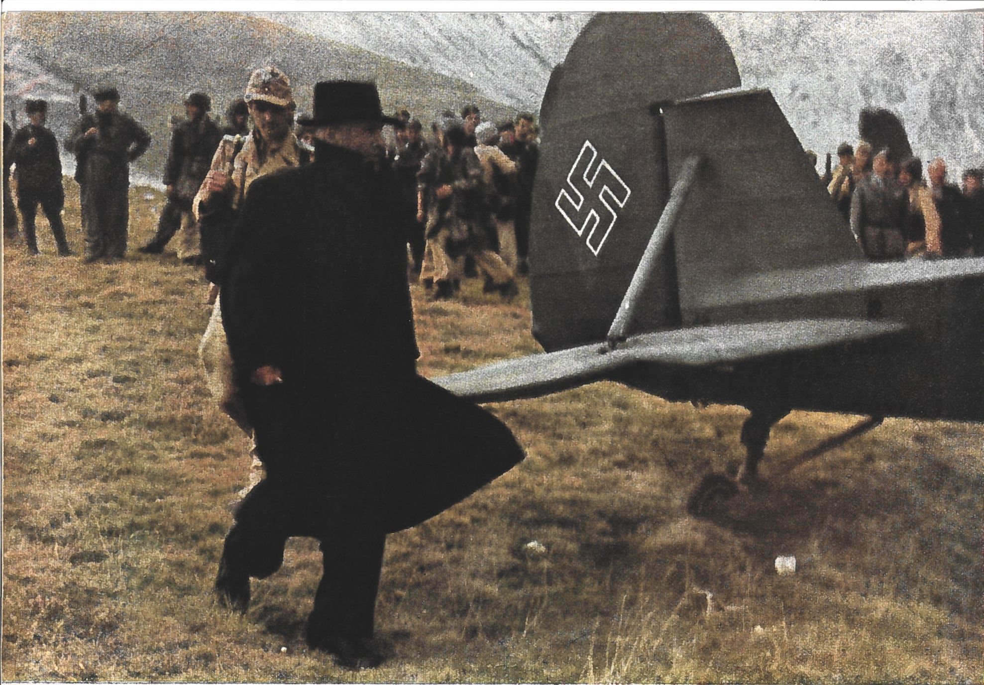
Le captif du Grand Sasso: Benito Mussolini. Que doit-on faire de ses geôliers, si rapidement maîtrisés? « En liberté! », répond le Duce, puis il se rend au « Fieseler Storch »