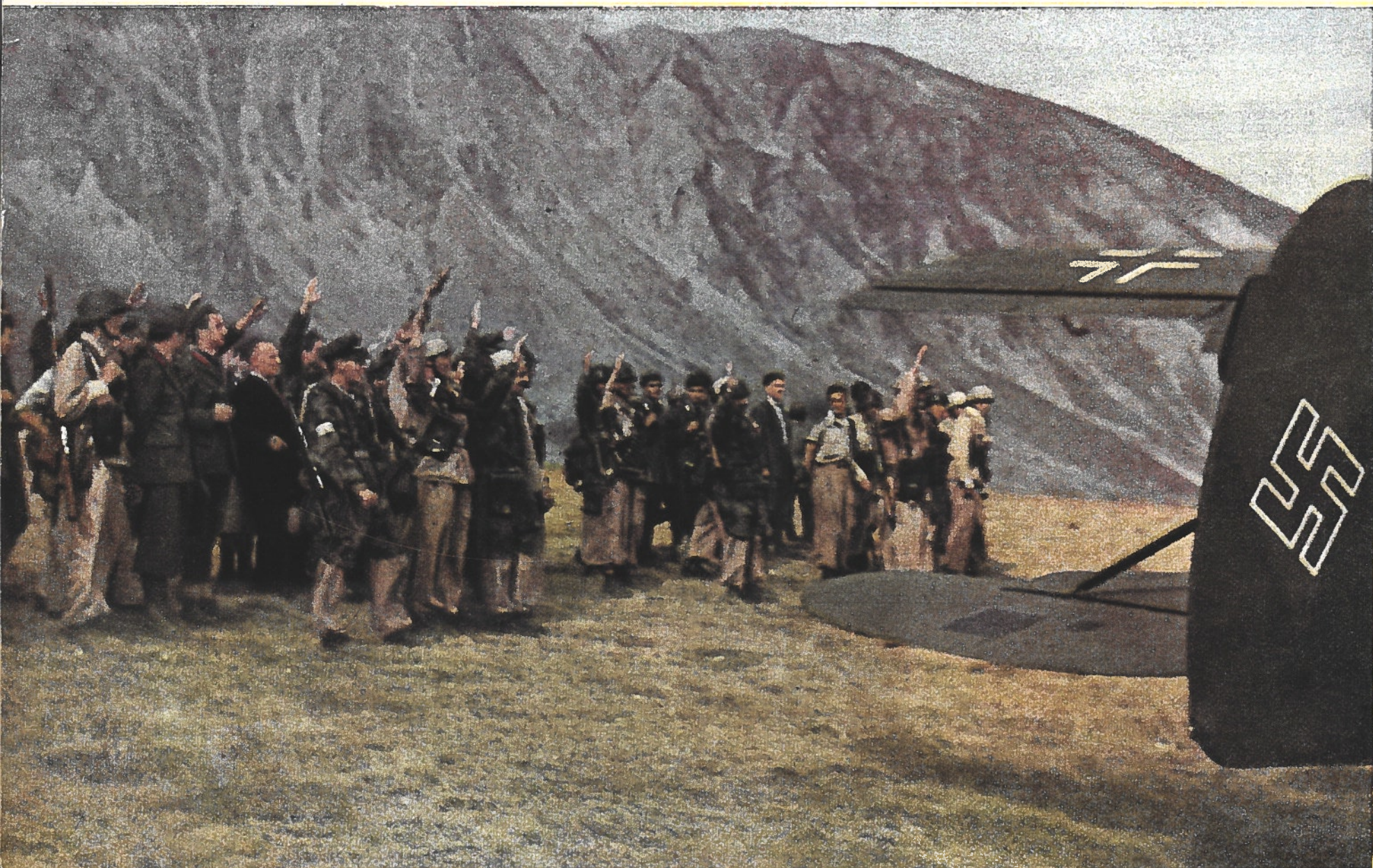
Bonne chance! A 2.000 mètres d'altitude, les libérateurs acclament le Duce. L'avion décolle. En bas, dans toute l'Italie, des milliers de « Chemises Noires » attendent celui qui a reforgé Rome, et créé l'Italie nouvelle!