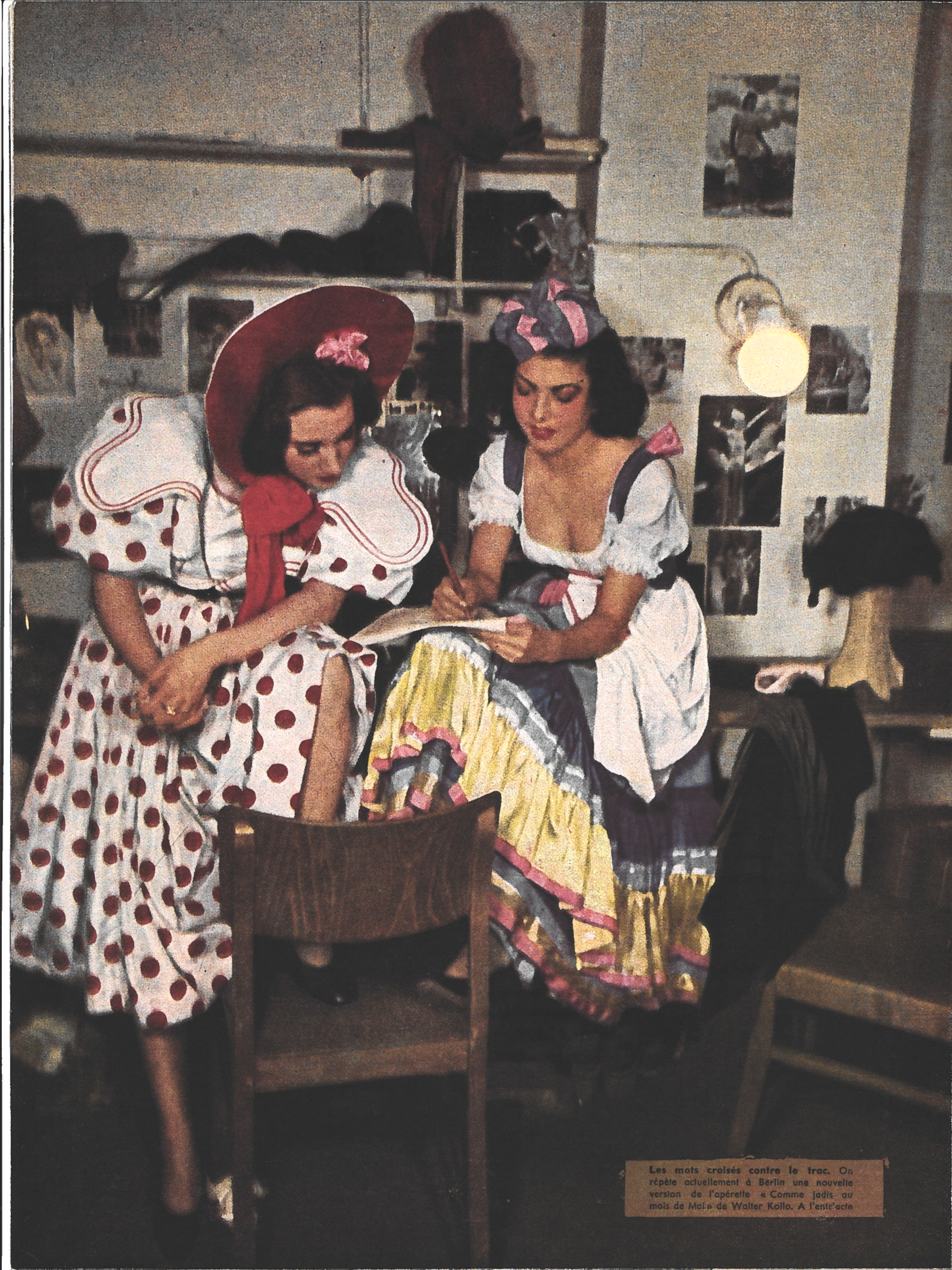
Les mots croisés contre le trac. On répète actuellement à Berlin une nouvelle version de l'opérette « Comme jadis au mois de Mai » de Walter Kollo. A l'entr'acte