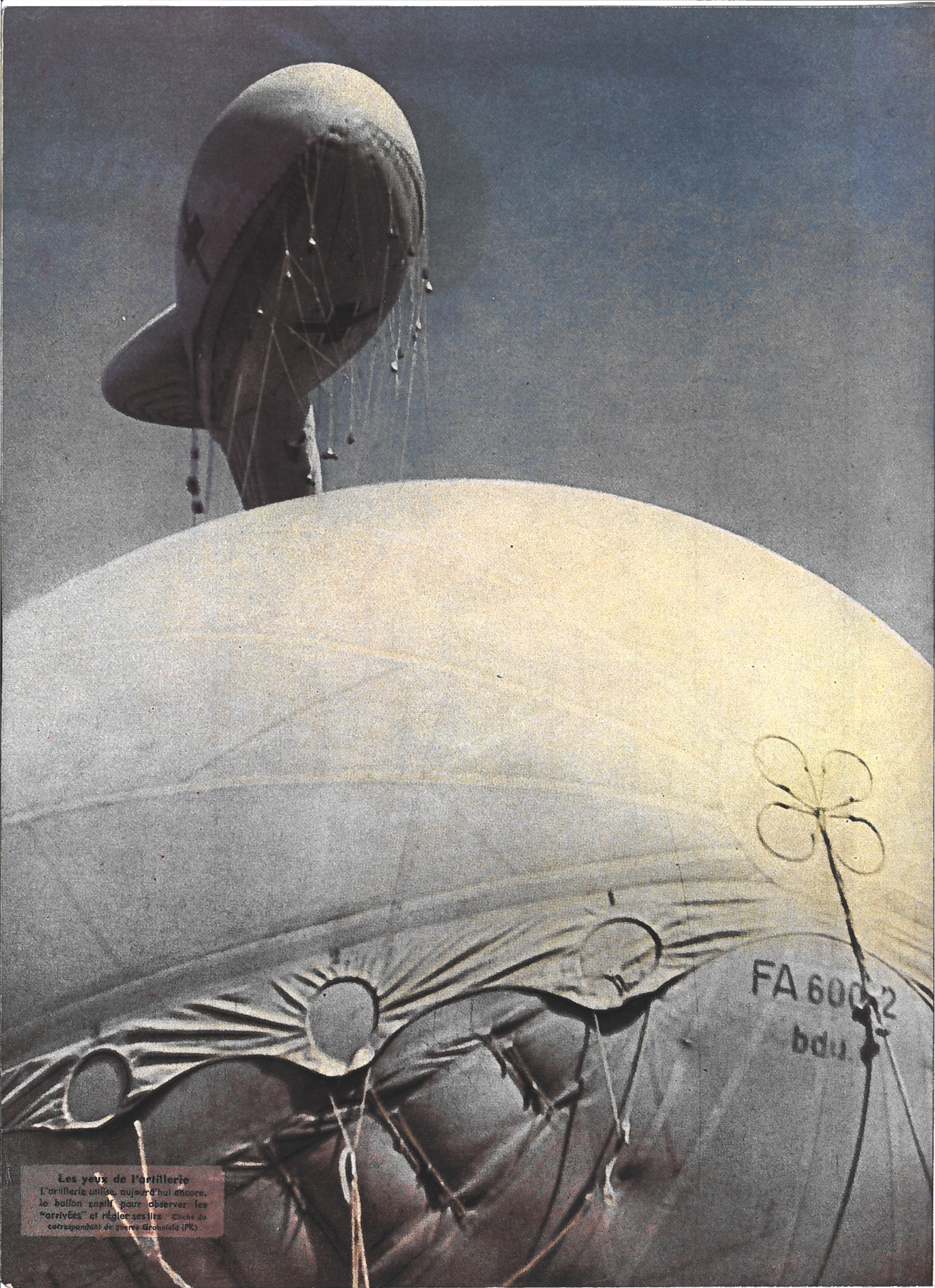
Les yeux de l'artillerie L'artillerie utilise, aujourd'hui encore, le ballon captif pour observer les "arrivées" et régler ses tirs.

Le moral pu à l'étra gouvernem de payer dollars par électriques d'Acora, al mée améri même terr mois. Ce n truire des d'Erythrée, raient envo syndiqués. faire le jeu leurs, qui cialiste éle supplément général Eis