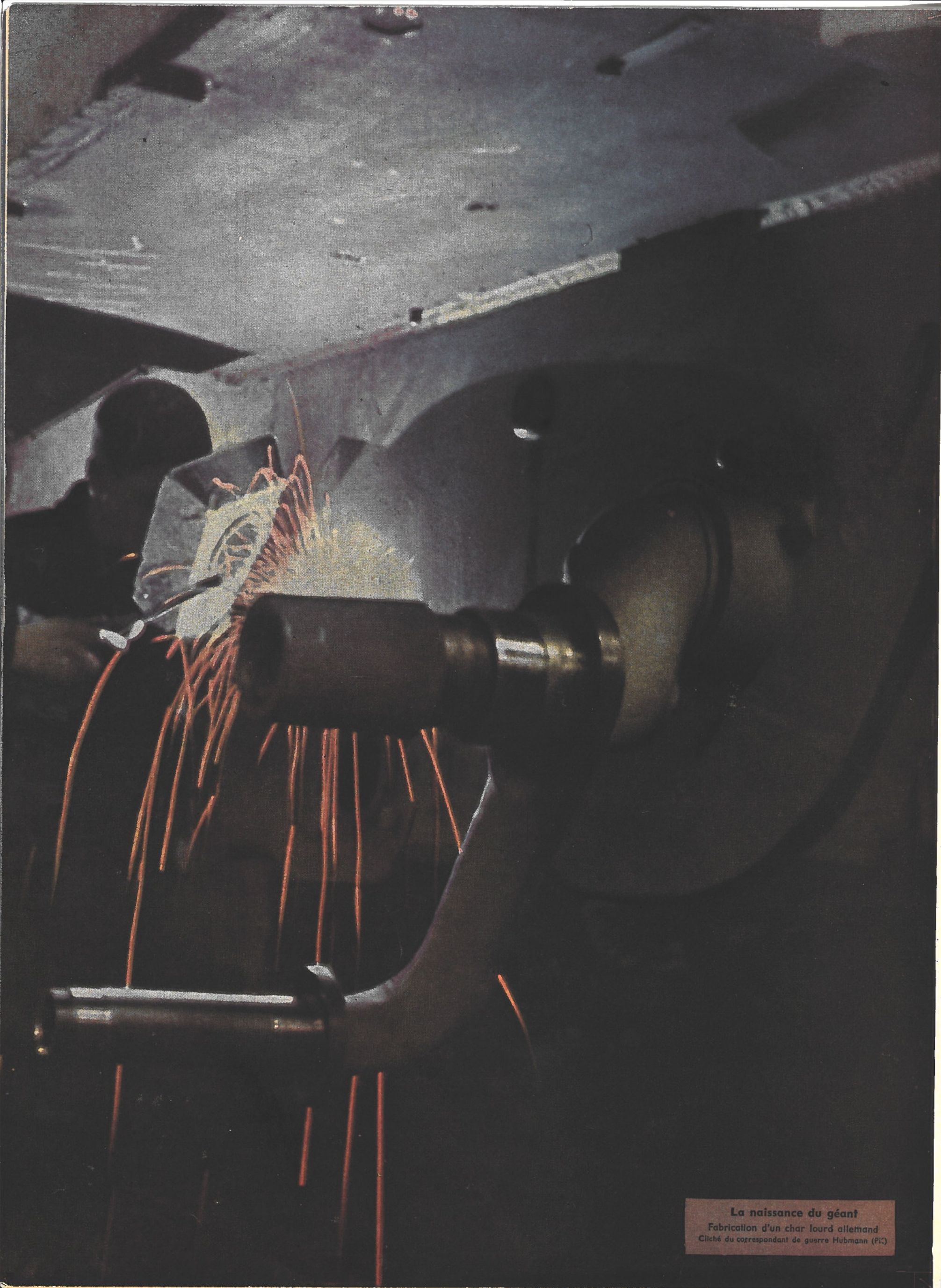
La naissance du géant Fabrication d'un char lourd allemand