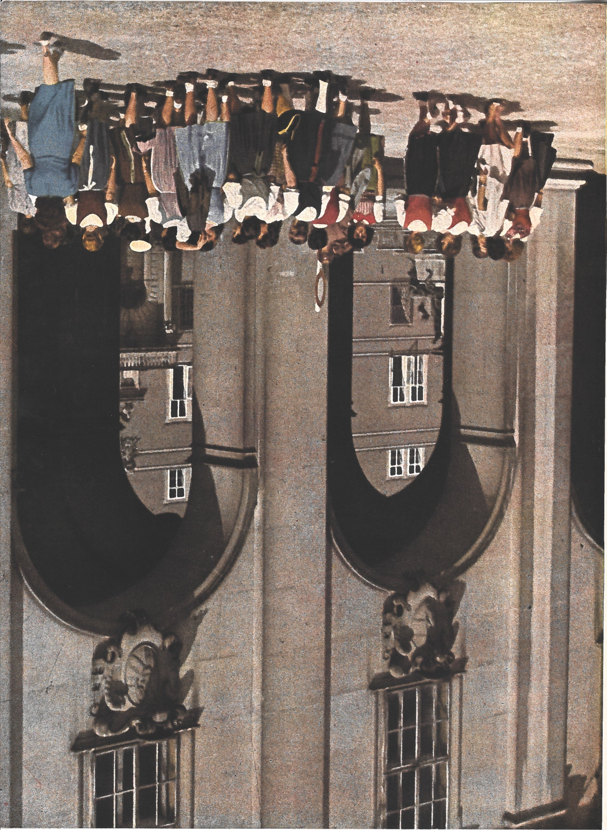
← s le gai Salzburg. tantes devant le «Mo- sum», qui renferme, même temps qu'un ervatoire, une biblio- thèque considérable sur dri et de belles salles de concert