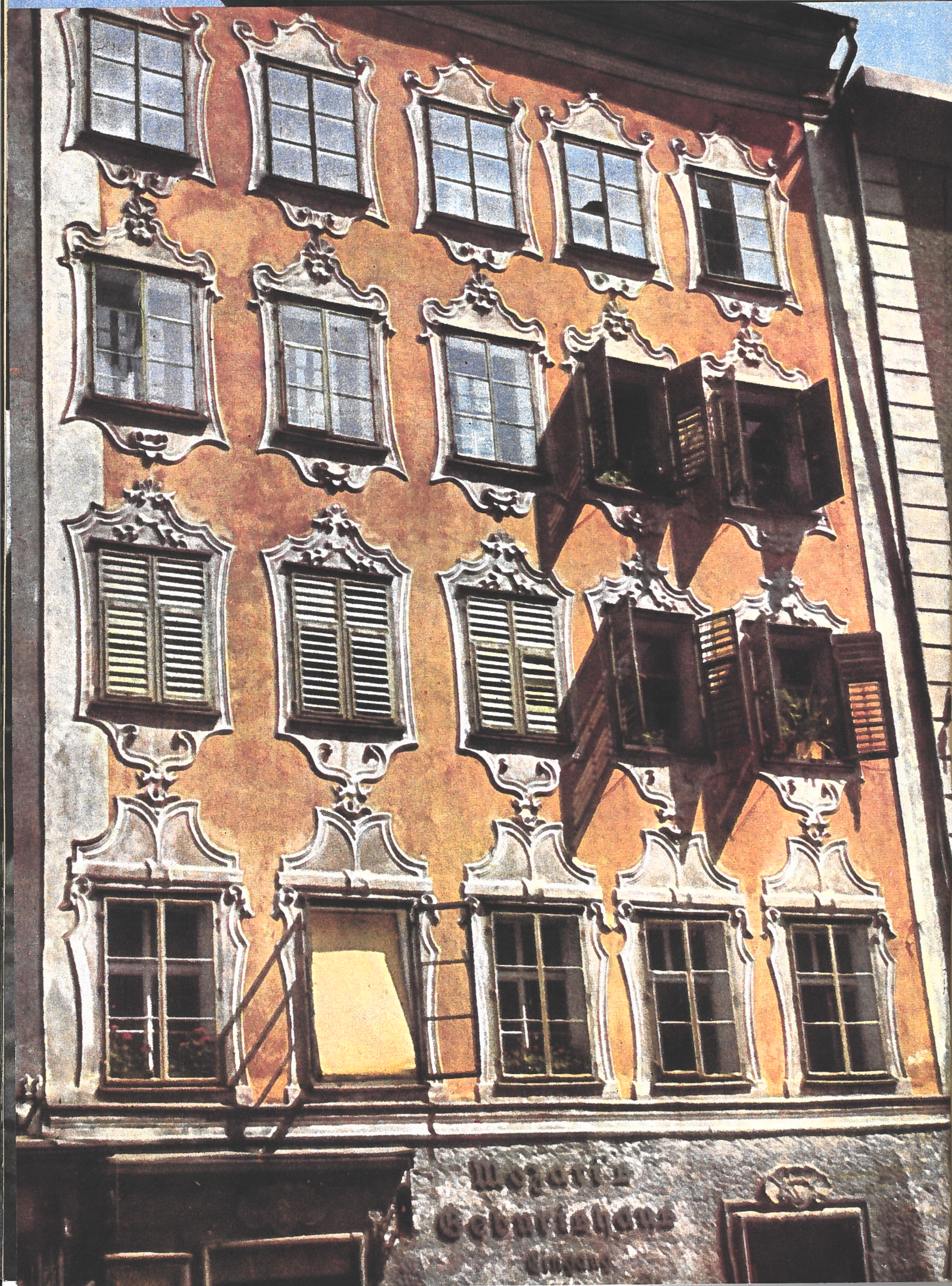
← Les claires fenêtres de cette vieille maison bourgeoise de Salzbourg sont agrémentées d'ornements blancs : rose en style rococo. C'est derrière ces fenêtres que naquit, le 27 janvier 1756, Wolfgang Amadeus Mozart, le génie musical qui devait donner au monde tant d'œuvres impérissables.