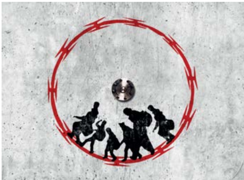
Illustration de Jorge Alaminos

financières privées et aux autres détenteurs de titres de la dette. Pour se refinancer, c'est-à-dire, réemprunter pour rembourser une dette précédente, les gouvernements de ces pays faisaient dès lors face à des taux d'intérêt faramineux.