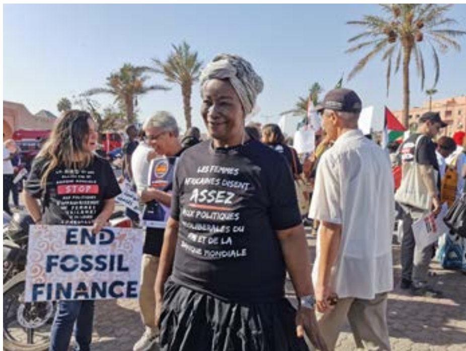
Aminata Traoré, auteure de le Viol de l'imaginaire , lors du contre-sommet face à la BM et au FMI en octobre 2023 à Marrakech

tant dans l'agriculture que dans l'industrie et l'artisanat - ce d'autant plus qu'ils incorporent désormais de nombreux intrants importés suite à l'abandon des politiques « autocrates » - mais le pouvoir d'achat de la grande masse de leurs consommateurs stagne ou baisse (le FMI interdisant toute indexation des salaires).