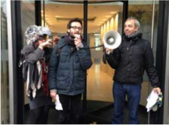
Action menée par le CADTM contre les fonds vautours, Bruxelles 2015