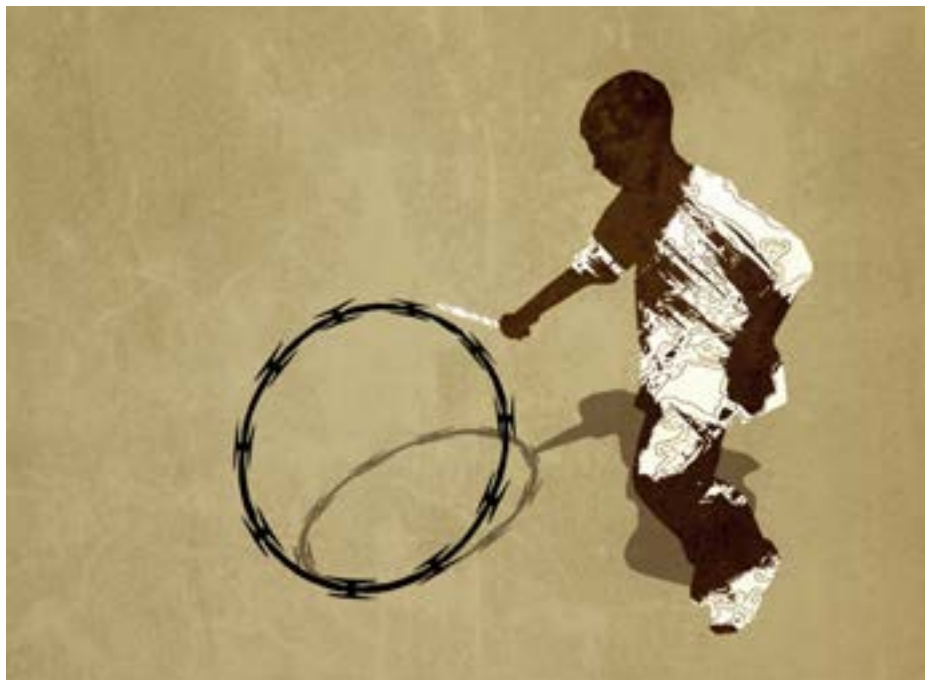
Illustration de Jorge Alaminos

sans contrat décent, sans salaire décent, sans congés payés, sans droit aux indemnités de maladie, sans droit de grève.