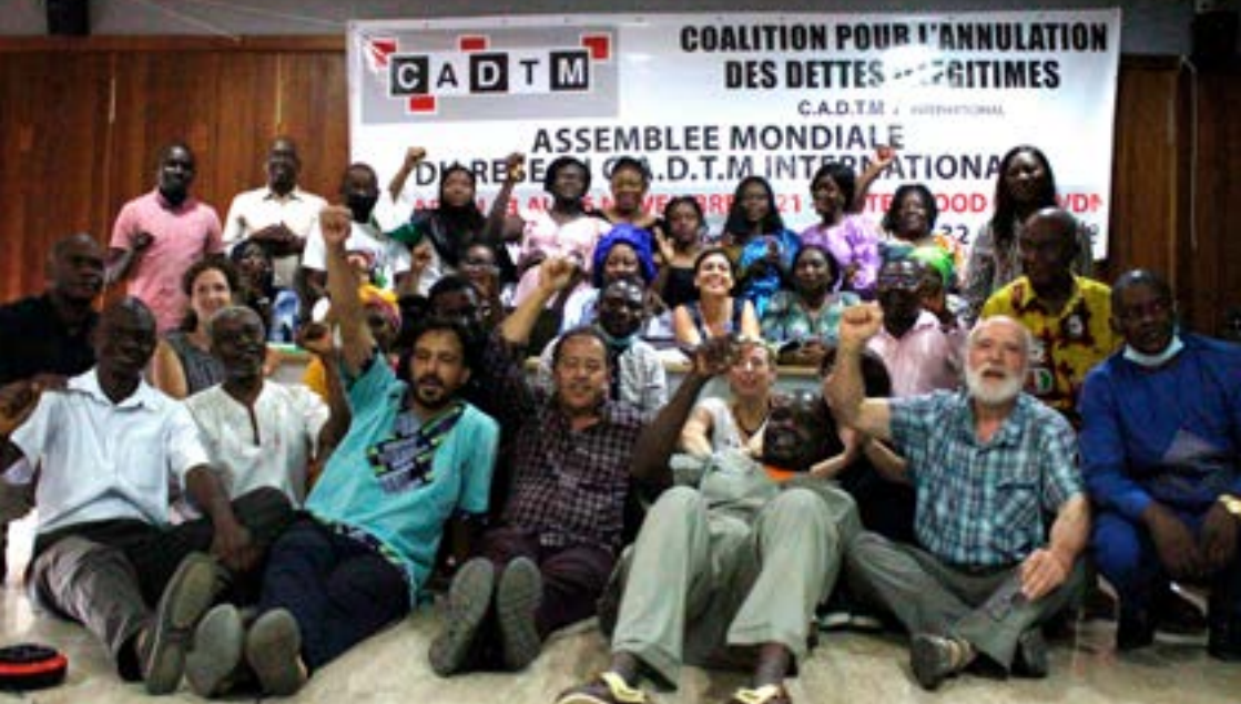
Assemblée mondiale du réseau CADTM International, Dakar, Sénégal, 13-16 Novembre 2021.

membres du réseau lors de rendez-vous internationaux, favoriser la collaboration avec les autres organisations internationales avec lesquelles le réseau collabore. Le SIP peut inviter les membres du CI à participer à ses réunions en ligne.