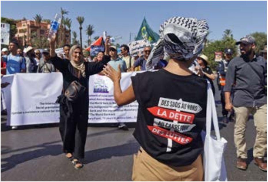
Marta Garrich-WoMin/IMF-WB counter summit Marrakesh 2023