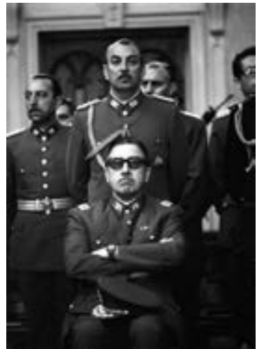
Augusto Pinochet (1915 - 2006), président du Chili après avoir dirigé un coup d'État soutenu par les États-Unis le 11 septembre 1973.

Les classes dominantes locales ont également poussé à l'augmentation de la dette et en ont tiré profit sans qu'il y ait de bénéfice pour les peuples.