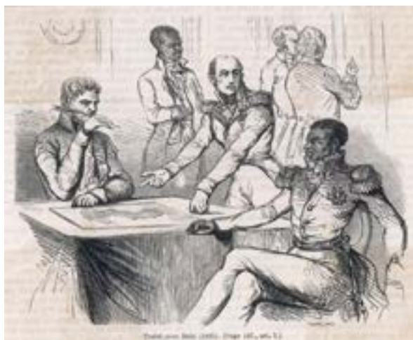
Signature du traité entre Haïti et la France, 1825

avec le boulet d'une dette qui l'enchaînait au Royaume-Uni, à la France et à la Russie 6 . L'île de Terre-Neuve, devenue en 1855 le premier dominion autonome de l'Empire britannique, bien avant le Canada ou l'Australie, a renoncé à son indépendance après la grave crise économique de 1933 pour faire face à ses dettes. Elle a finalement été rattachée en 1949 au Canada qui a accepté de reprendre 90 % de sa dette (REINHARDT et ROGOFF, 2010).