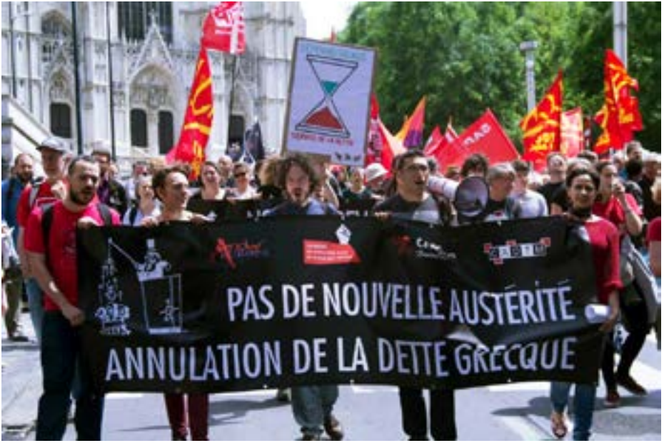
Manifestation en soutien au peuple grec, Bruxelles 2015

nières années n'ont été que des marchés de dupes d'autant qu'elles ont été assorties de conditionnalités néfastes pour les pays qui en ont « bénéficié ».