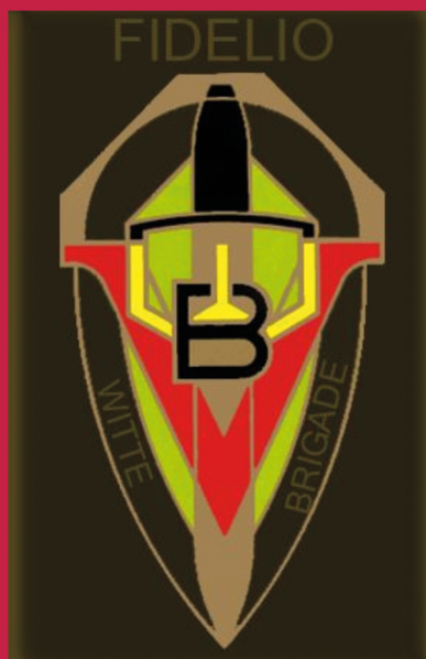
Blason Witte Brigade/Fidelio