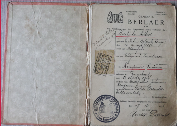
Livret de famille d'Albert Kudjabo